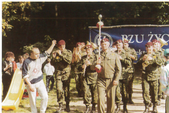
Wojskowa orkiestra bardzo się podobała.

miłym gościom Samorządowy Ośrodek Kultury w Zielonkach. Przy tak wielu atrakcjach i świetnej pogodzie nic więc dziwnego, że przez kilka godzin na łące bawiono się i tańczono radośnie.