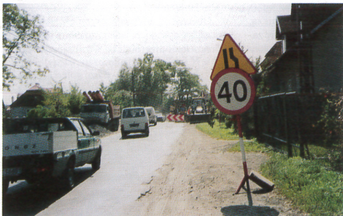
Foto 1. Rozpoczęto od poszerzania drogi. Zdarzało się, że tworzyły się korki - ciężki sprzęt zajmował jeden pas ruchu, drugim poruszali się użytkownicy drogi.

Dobiega końca trzeci etap generalnego remontu drogi 778 Kraków - Skała - Wolbrom. W dzisiejszym numerze mamy dla Państwa kilka zdjęć z jego przebiegu.