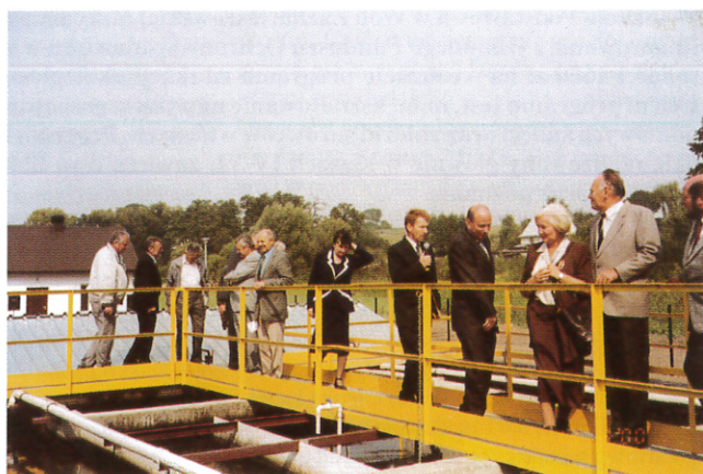
Goście zwiedzają oczyszczalnię

Przypomnijmy, że budowę oczyszczalni rozpoczęto w czwartym kwartale 1999 r., a roboty zakończono 15 sierpnia 2000 r. Cena całości robót budowlano-montażowych to 827 tys. 955 zł. Źródłami finansowania inwestycji były: w większości budżet gminy Zielonki i wpłaty mieszkańców, Unia Europejska - program INRED (grant w wysokości 255 tys. zł); dodatkowo swój udział finansowy zaznaczyła Fundacja Wspierania Wsi kredytem preferencyjnym w wysokości 200 tys. zł. W wyniku wcześniejszych porozumień cegiełkę w wysokości 160 tys. zł dołożył również Urząd Wojewódzki. Oczyszczalnia została zaprojektowana z rezerwą umożliwiającą zabezpieczenie potrzeb rozwijającej się miejscowości.