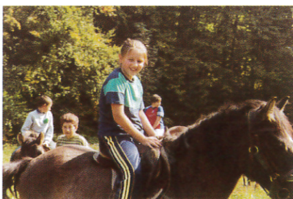
Atrakcją była konna przejażdżka.

W tym roku w „Barwach jesieni” uczestniczyło ok. 1200 osób - od przedszkolaków do dorosłych. Oprócz zabaw dla najmłodszych były też więc i atrakcje dla nieco starszych. Dla nich właśnie żołnie-