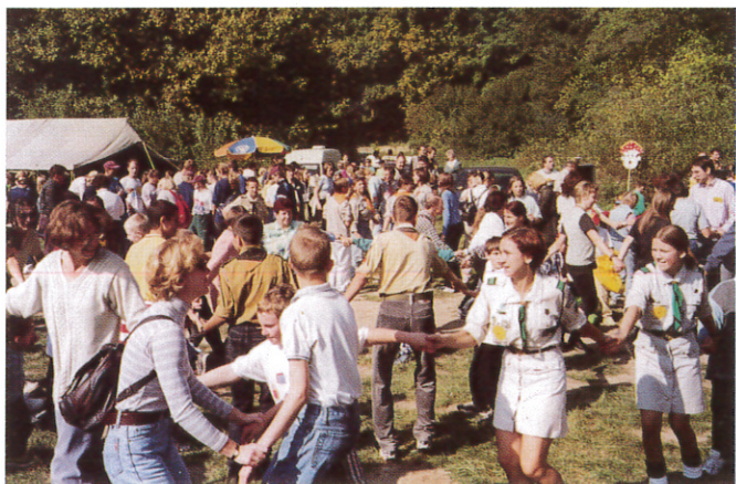
Wspólna zabawa przy muzyce.