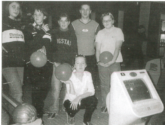
Uczniowie II klasy gimnazjum w Zielonkach w „Atomicu”.