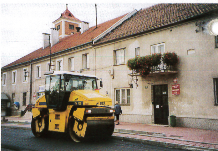
Foto 4. Wylewanie nakładki asfaltowej w centrum Zielonek 11 października 2000 r.

Kiedy oddajemy Państwu ten numer do druku, trwają jeszcze ostatnie prace przy budowie odwadniania drogi. Uroczyste otwarcie drogi 5 grudnia.