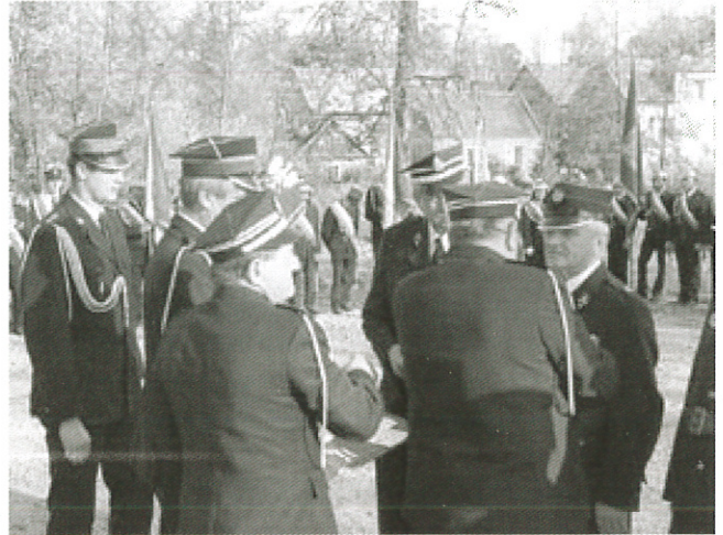
Wręczenie medali strażakom

Obecnie w Bibicach czynnie działa 32 strażaków, dysponują jedenastoletnim starem, którego sami przerobili na wóz bojowy. Nie