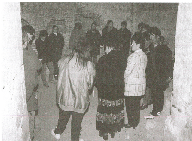
Nauczyciele podczas zajęć

tyce profilaktyki antyuzależnieniowej. Przygotowują one nauczycieli do trudnego zadania, jakim jest przeciwstawienie się wszech-