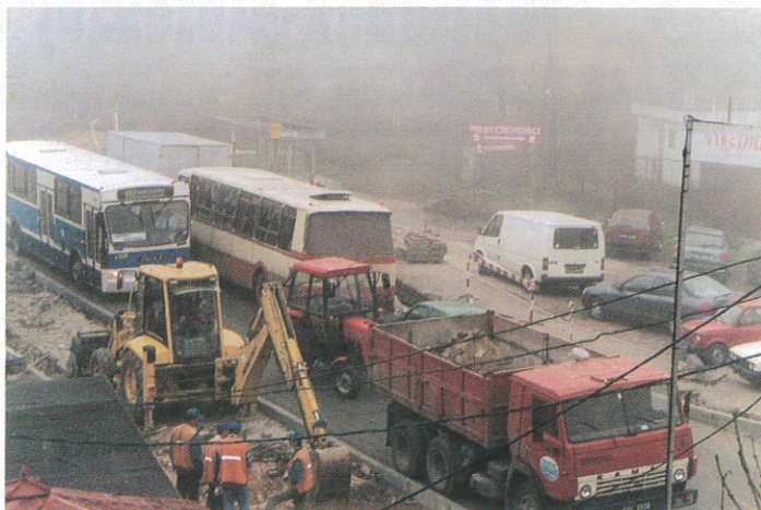
Foto 2. Przesunięto zatoczek autobusowe i zlikwidowano parking przed Urzędem Gminy poprawiając w ten sposób widoczność na skrzyżowaniu.