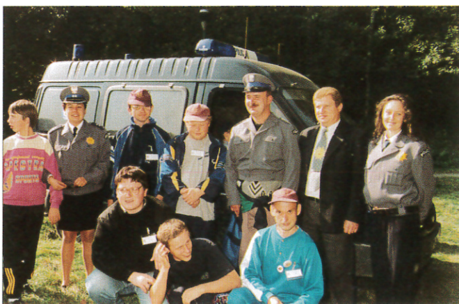
Na koniec jeszcze pamiątkowe zdjęcie z policją.