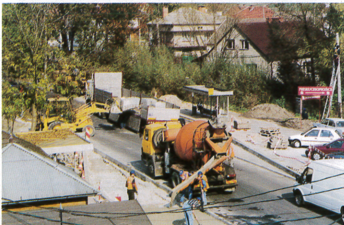
Foto 3. Nową kostkę położono na chodnikach i zatoczkach autobusowych. Wcześniej podłoże utwardzono i w zatoczkach wylano beton, by nie tworzyły się koleiny.