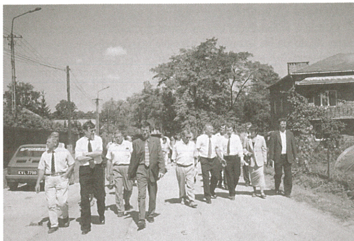
Radni w Węgrzcach podczas objazdowej sesji