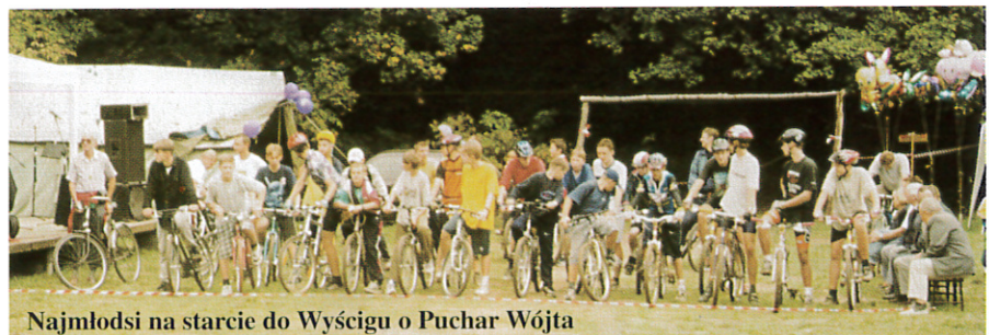
Najmłodszy na starcie do Wyścigu o Puchar Wójta