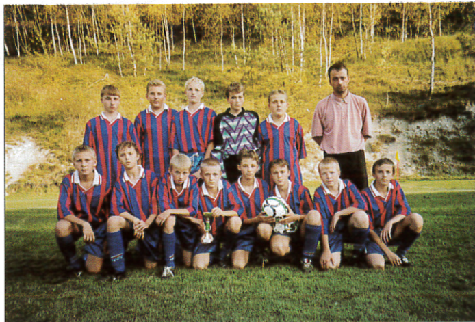
Najlepsi trampkarze młodsi z Zieleńczanki z trenerem