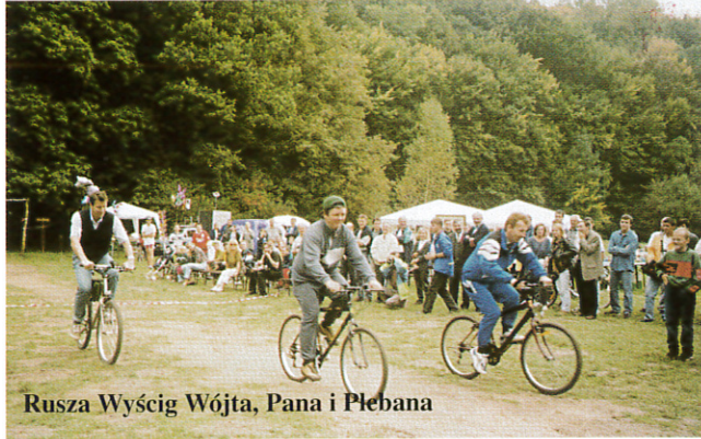
Rusza Wyścig Wójta, Pana i Plebana

Kto żyw w wieku 13-17 lat stanął na starcie Wyścigu Rowerowego na Przełaj o Puchar Wójta Gminy Zielonki. Nic dziwnego, było o co walczyć - na zwycięzcę czekał rower gór-