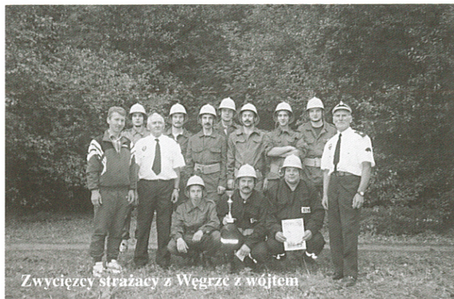
Zwycięzcy strażacy z Węgrzc z wójtem

Nie był to jednak koniec rywalizacji samorządowców. Czekala ich jeszcze walka o tytuł Mistrza Nieoficjalnej Sytuacji . Do ry-