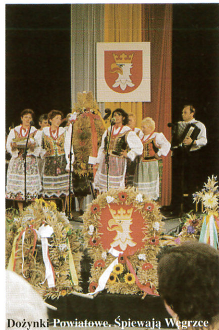
Dożynki Powiatowe. Śpiewają Węgrzce

Na kogo padnie, na tego bęc. Padło na Skawinę. Pojechaliliśmy 19 września na I Dożynki Powiatowe zorganizowane przez starostwo. Naszą gminę, jak już wspomniałam, reprezentowały panie z Koła Gospodyń Wiejskich z Węgrzc - zdobywczyni pierwszej nagrody na Dożynkach Gminnych. Napisały świetne teksty do przyśpiewek, uwiły piękny