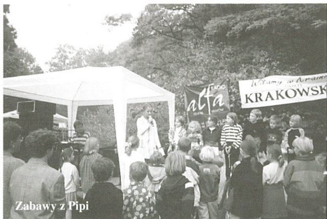
Zabawy z Pipi

Następnie do rywalizacji stanęli „niepolitycy” rowerzyści-amatorzy. Wszystkich chcących walczyć w Wyścigu o Puchar Wójta Gminy Zielonki podzielono na trzy kategorie wiekowe: 13-17 lat (tu pierwszą nagrodą