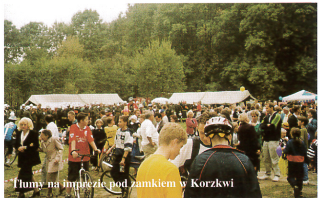
Tłumy na imprezie pod zamkiem w Korzkwi

-Trasa wyścigu była naprawdę niebezpieczna - wspominał po wyścigu B. Król. -