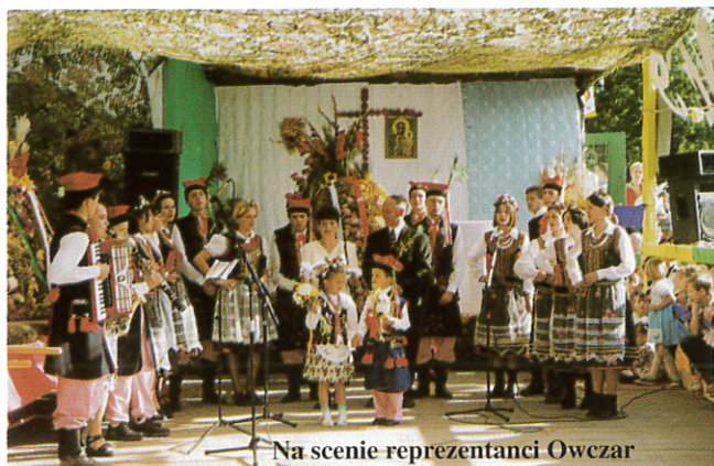
Na scenie reprezentanci Owczar

W tym roku gospodarzami dożynek było sołectwo Owczary. A rzecz działa się 5 września na pętli MPK. Bawiono się tam od godz. 14.00 do białego rana. Takich tłumów na Dożynkach Gminnych jeszcze nie było.