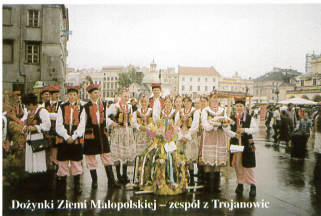
Dożynki Ziemi Małopolskiej - zespół z Trojanowic