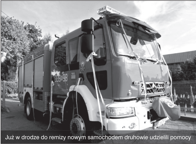
Już w drodze do remizy nowym samochodem drухowie udzielili pomocy