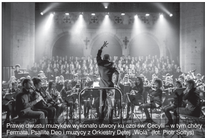
Prawie dwustu muzyków wykonało utwory ku czci św. Cecylii – w tym chóry Fermata, Psallite Deo i muzycy z Orkiestry Dętej „Wola” (fot. Piotr Sołtys)