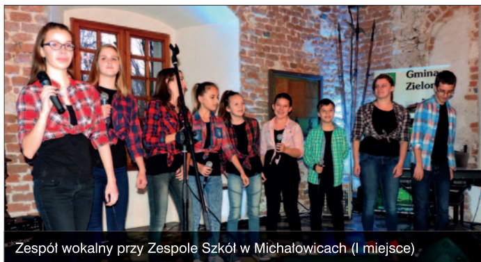
Zespół wokalny przy Zespole Szkół w Michałowicach (I miejsce)