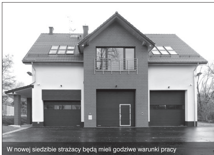
W nowej siedzibie strażacy będą mieli godziwe warunki pracy