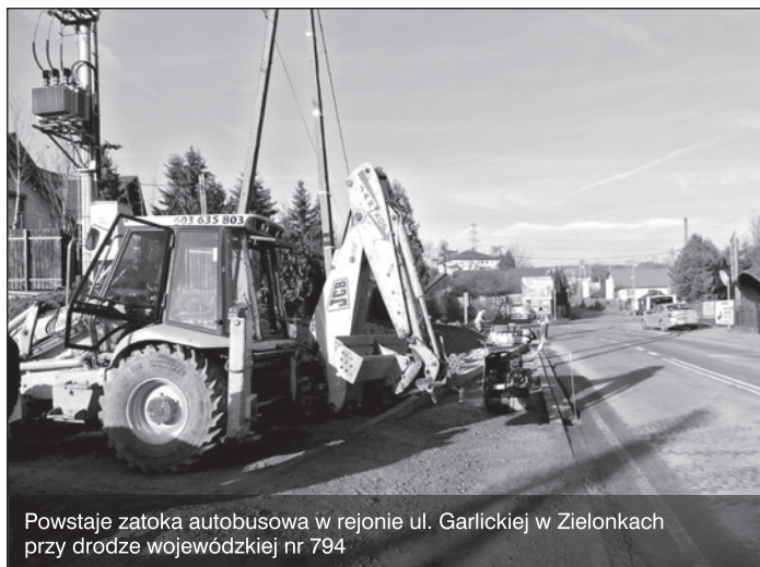
Powstaje zatoka autobusowa w rejonie ul. Garlickiej w Zielonkach przy drodze wojewódzkiej nr 794