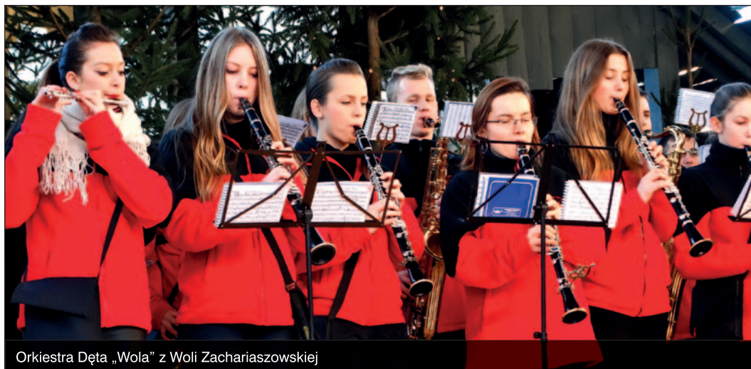
Orkiestra Dęta „Wola” z Woli Zachariaszowskiej