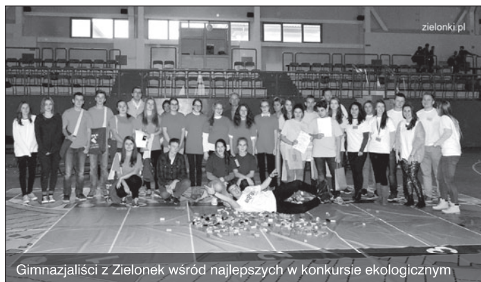
Gimnazjaliści z Zielonek wśród najlepszych w konkursie ekologicznym