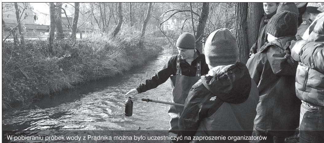
W pobieraniu próbek wody z Prądnika można było uczestniczyć na zaproszenie organizatorów