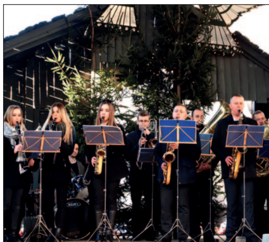
Orkiestra Dęta Korzkiew