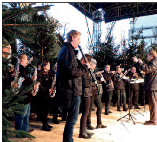
Parafialno-Gminna Orkiestra Dęta z Zielonek