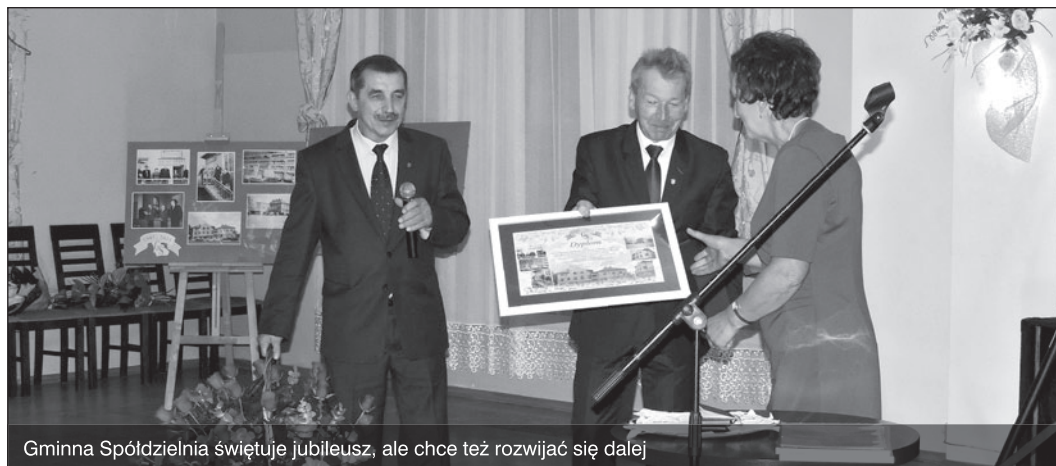
Gminna Spółdzielnia świętuje jubileusz, ale chce też rozwijać się dalej