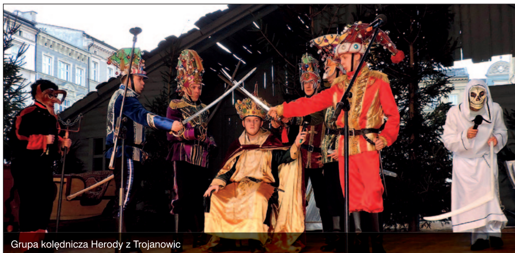
Grupa kolędnicza Herody z Trojanowic