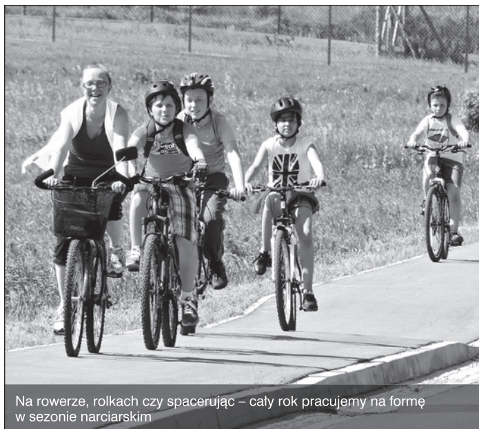
Na rowerze, rolkach czy spacerując – cały rok pracujemy na formę w sezonie narciarskim