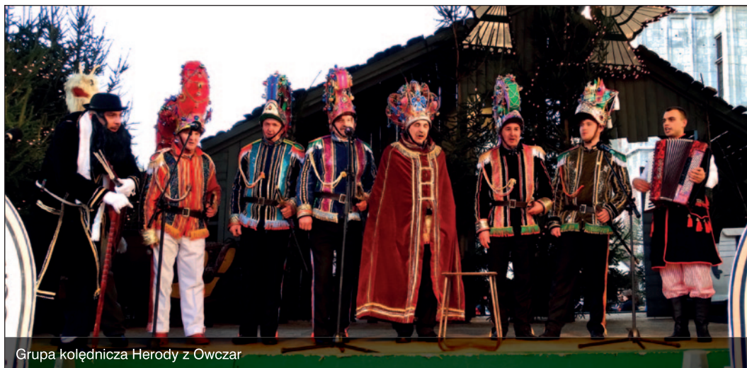
Grupa kolędnicza Herody z Owczar