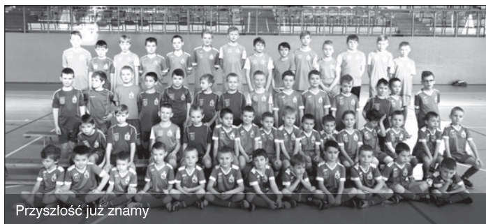
Przyszłość już znamy