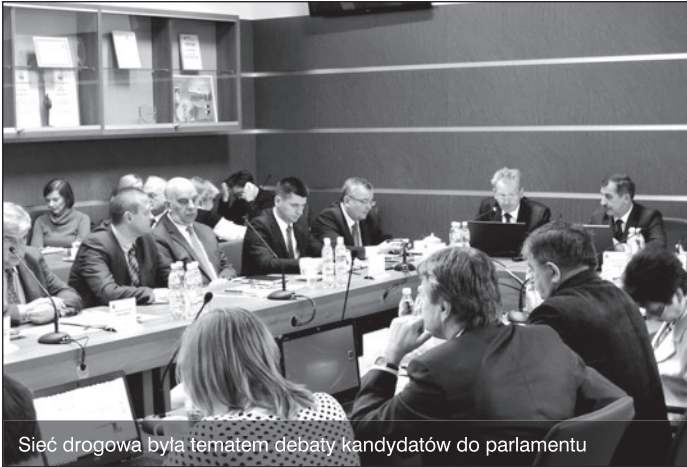
Sieć drogowa była tematem debaty kandydatów do parlamentu