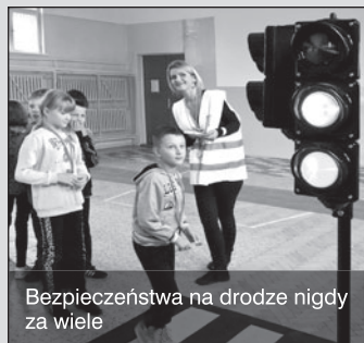
Bezpieczeństwa na drodze nigdy za wiele