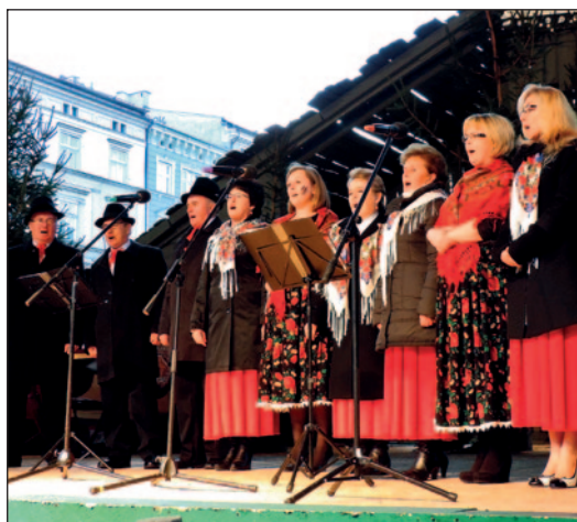
Gawędziarze i Śpiewacy z Grębynic