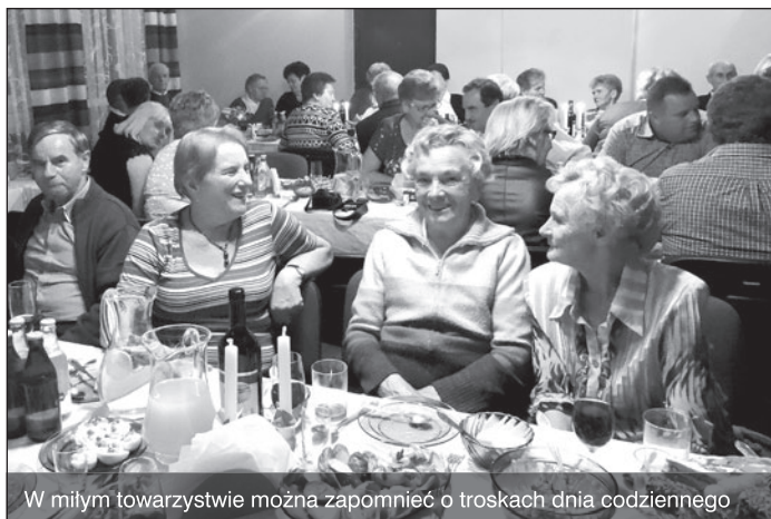
W miłym towarzystwie można zapomnieć o troskach dnia codziennego