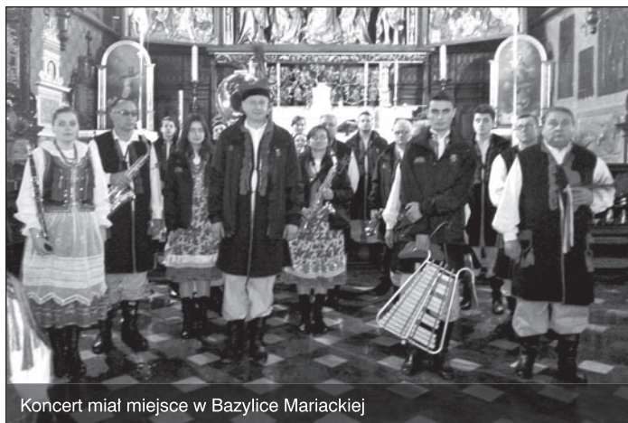
Koncert miał miejsce w Bazylice Mariackiej