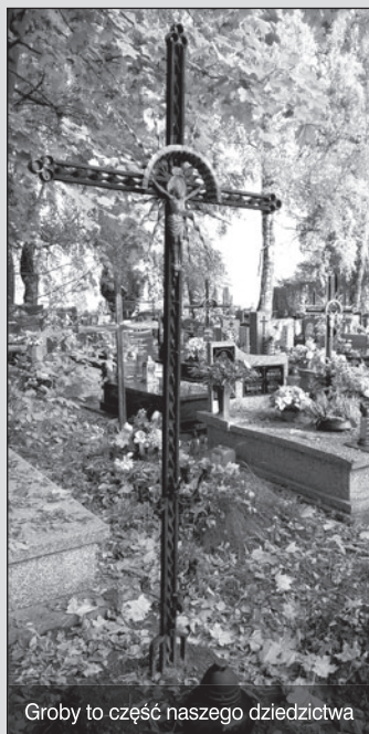
Groby to część naszego dziedzictwa