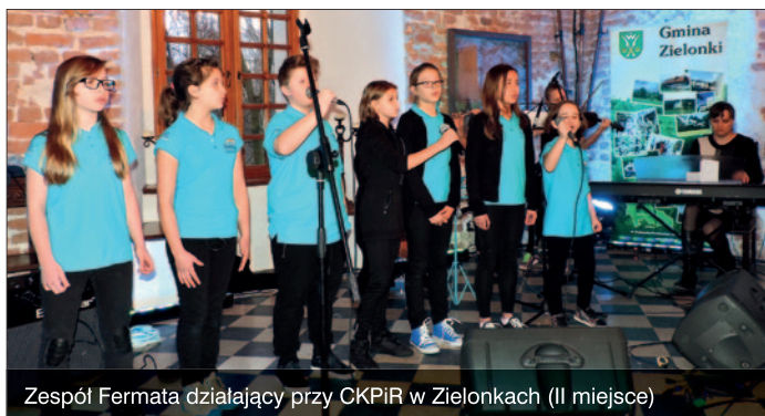
Zespół Fermata działający przy CKPiR w Zielonkach (II miejsce)