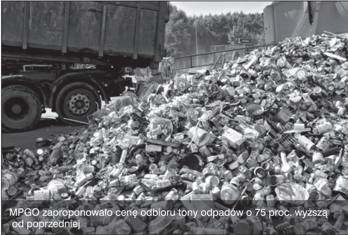
MPGO zaproponowało cenę odbioru tony odpadów o 75 proc. wyższą od poprzedniej