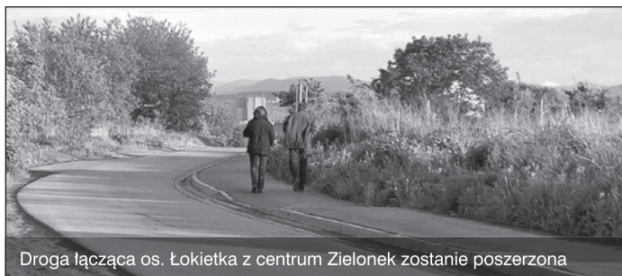
Droga łącząca os. Łokietka z centrum Zielonek zostanie poszerzona