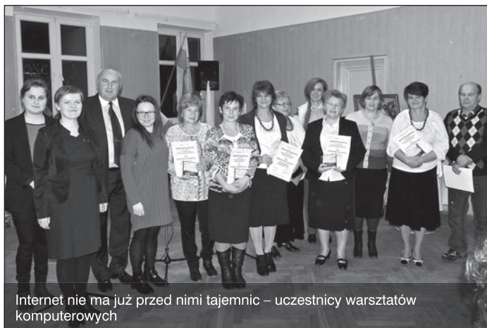
Internet nie ma już przed nimi tajemnic – uczestnicy warsztatów komputerowych