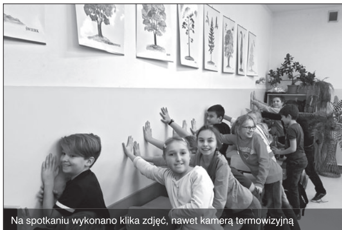
Na spotkaniu wykonano kilka zdjęć, nawet kamerą termowizyjną