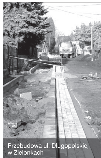
Przebudowa ul. Długopolskiej w Zielonkach