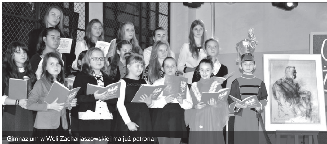
Gimnazjum w Woli Zachariaszowskiej ma już patrona