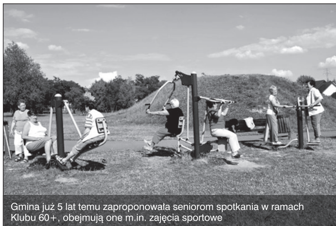
Gmina już 5 lat temu zaproponowała seniorom spotkania w ramach Klubu 60+, obejmują one m.in. zajęcia sportowe