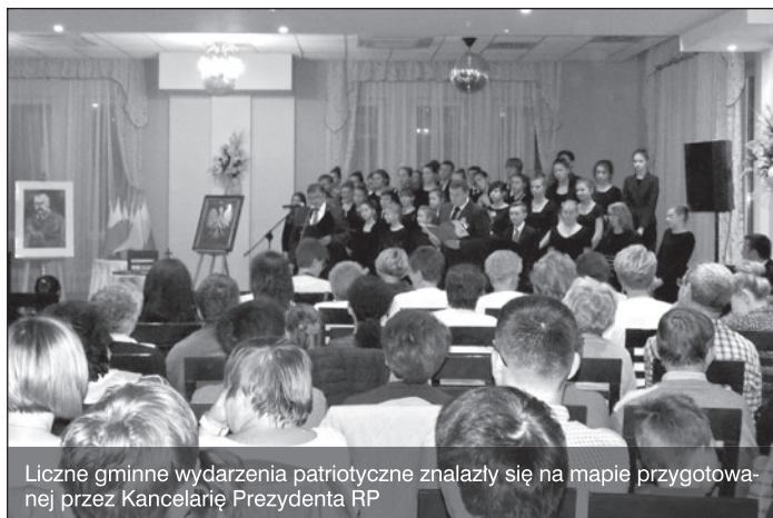
Liczne gminne wydarzenia patriotyczne znalazły się na mapie przygotowanej przez Kancelarię Prezydenta RP