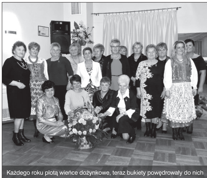
Każdego roku plotą wieńce dożynkowe, teraz bukiety powędrowały do nich