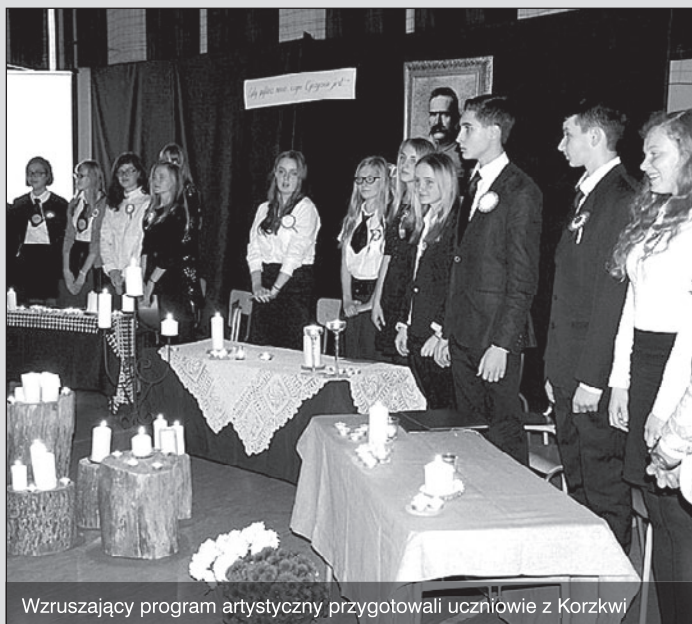
Wzruszający program artystyczny przygotowali uczniowie z Korzkwi

Wszystkie osoby, które wzięły udział w programie artystycznym oraz panie odpowiedzialne za przygotowanie uroczystości,