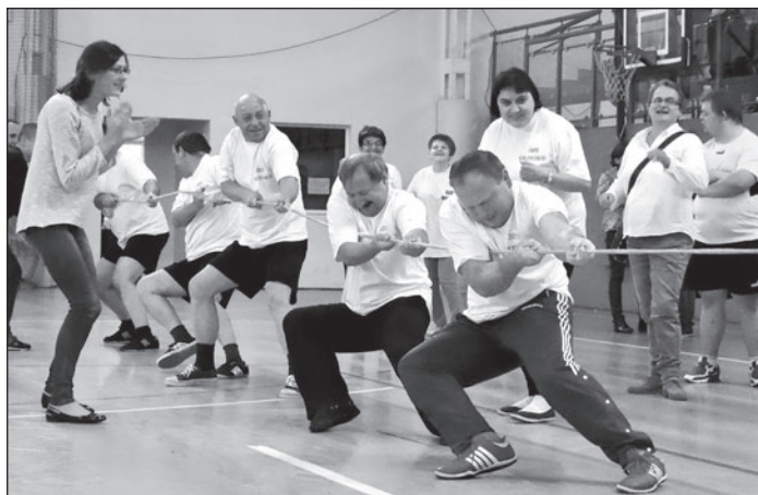
Przeciąganie liny to ulubiona konkurencja uczestników Zachariaszady, w której co roku bierze udział ponad pół tysiąca osób niepełnosprawnych