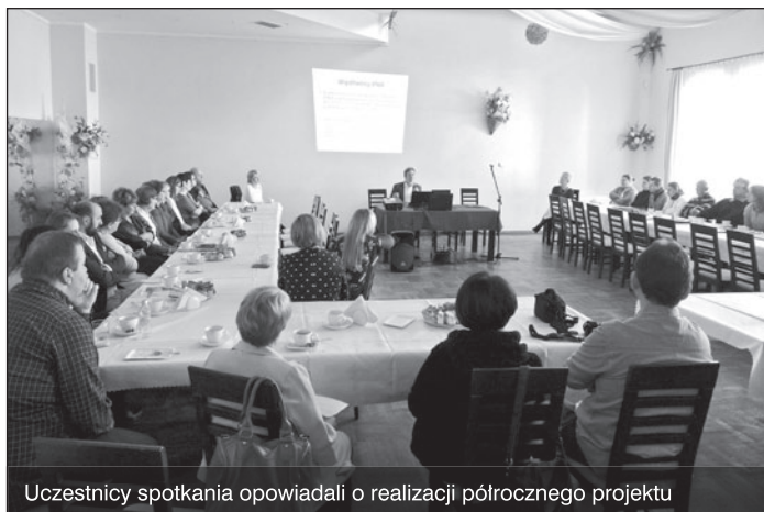
Uczestnicy spotkania opowiadali o realizacji półrocznego projektu