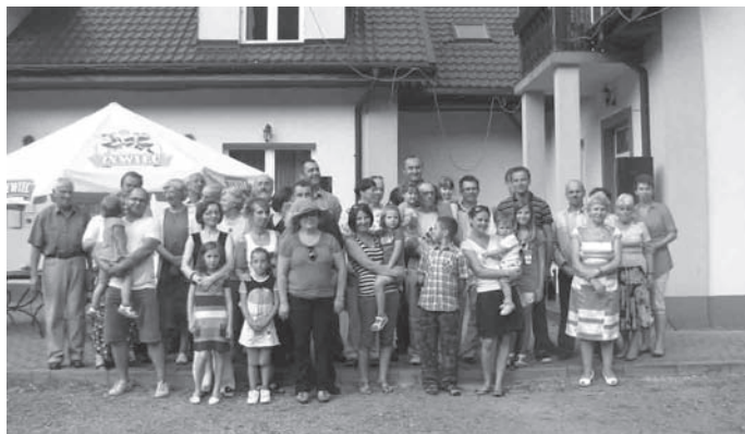
Mieszkańcy Januszowic po raz pierwszy zorganizowali piknik