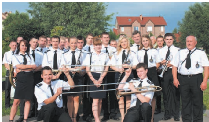
Lech Wnuk wyczarował batutą niezapomniane chwile...