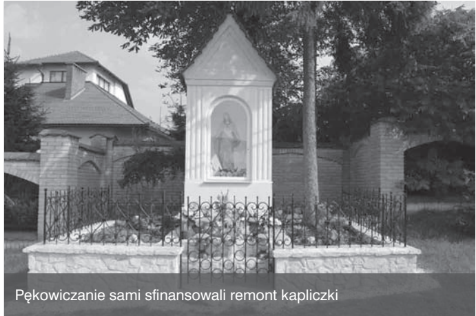
Pękowiczanie sami sfinansowali remont kapliczki

Gospodynie dawniej spotykały się na przykład na skubaniu pierza. Śpiewały, plotkowały, modliły się. Życie we wsi też inaczej wyglądało. – A ludzie dawniej jacy byli serdeczni, znali się tu wszyscy w Węgrzcach. I pomagali sobie. Moja mama jak piekła podplomyk to zawsze dwa jajka włożyła do koszyczka i się zanosilo biedniejszym we wsi. Ludzie byli bardziej religijni. Biedniej było niż teraz, ale chyba wolałam tamto życie i tamtych ludzi... – podsumowuje pani Krystyna. AM