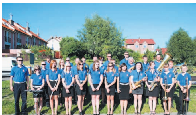
W orkiestrze z Korzkwi dominuje młodzież i nowoczesny repertuar.