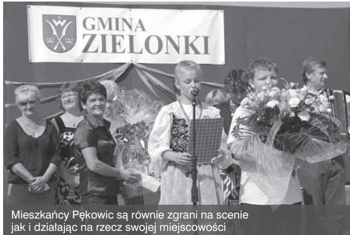
Mieszkańcy Pękowic są równie zgrani na scenie jak i działając na rzecz swojej miejscowości