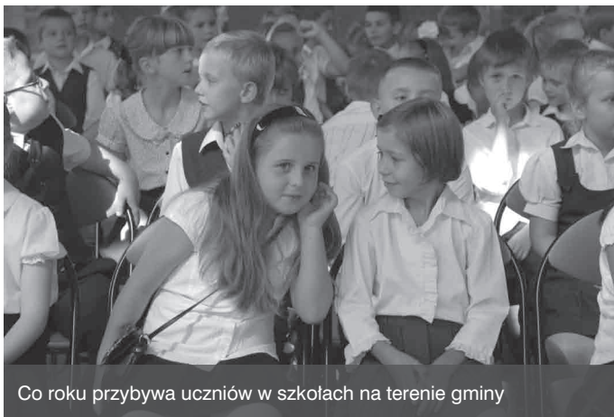
Co roku przybywa uczniów w szkołach na terenie gminy

Do tekstu „Przybywa dzieci w przedszkolach” niestety wkradły się błędy. Liczba dzieci w przedszkolu w Zielonkach wzrosła ze 175 w roku szkolnym 2010/2011 do 200 w roku szkolnym 2011/2012. Z powodu braku miejsc nie przyjęto do niego trojga trzylatków spełniających kryteria naboru oraz dziewięciorga, których rodzice nie spełnili warunku zameldowania na terenie gminy lub zatrudnienia przez oboje rodziców.