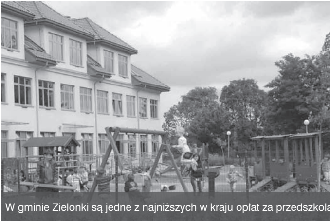
W gminie Zielonki są jedne z najniższych w kraju opłat za przedszkola