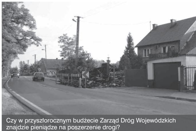
Czy w przyszłorocznym budżecie Zarząd Dróg Wojewódzkich znajdzie pieniądze na poszerzenie drogi?