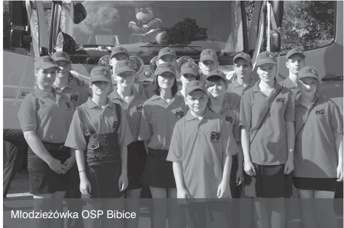
Młodzieżówka OSP Bibice

Wniosek o przyznanie pomocy należy złożyć na obowiązującym formularzu wraz z wymaganymi załącznikami. Formularz wniosku dostępny jest na stronach internetowych: Ministerstwa Rolnictwa i Rozwoju Wsi www.minrol.gov.pl , Urzędu Marszałkowskiego Województwa Małopolskiego www.fundusze.malopolska.pl , Lokalnej Grupy Działania www.koronakrakowa.pl