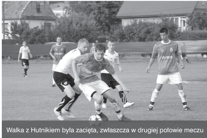
Walka z Hutnikiem była zacięta, zwłaszcza w drugiej połowie meczu

Na podst. inform. przyg. przez Referat Gospodarki Komunalnej UG Zielonki