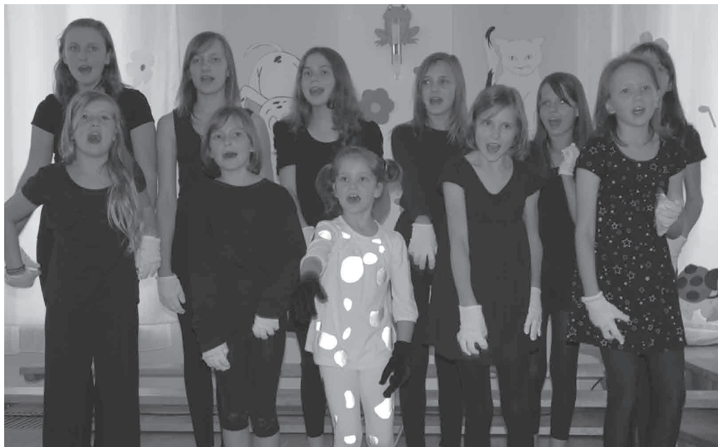
Utwór z filmu „101 dalmatyńczyków” w niezapomnianym wykonaniu zespołu