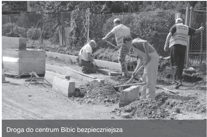
Droga do centrum Bibic bezpieczniejsza