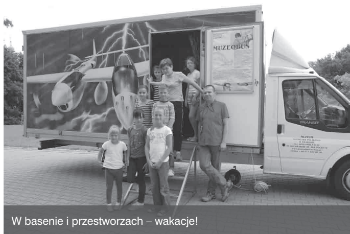
W basenie i przestworzach – wakacje!