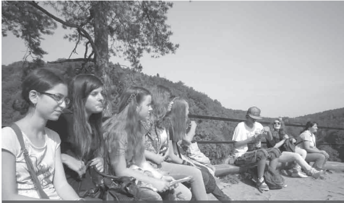
Zajęcia integracyjne w terenie to ciekawa propozycja dla uczniów