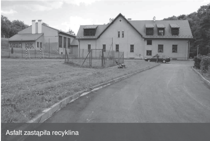
Asfalt zastąpiła recyklinga