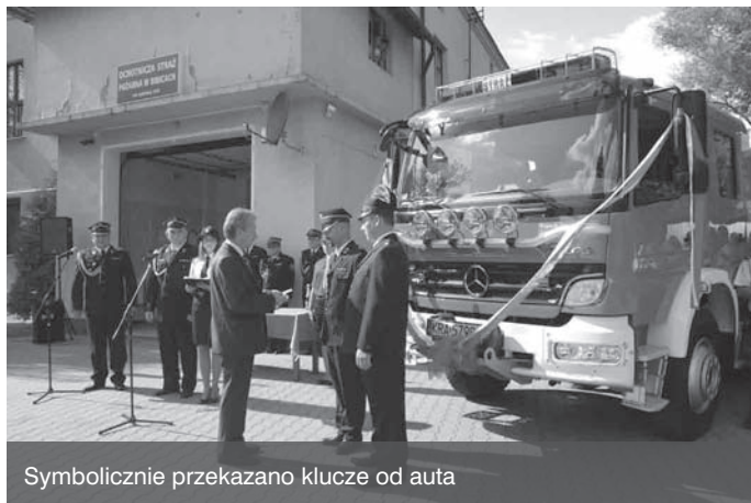
Symbolicznie przekazano klucze od auta