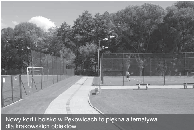
Nowy kort i boisko w Pękowicach to piękna alternatywa dla krakowskich obiektów