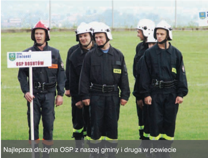
Najlepsza drużyna OSP z naszej gminy i druga w powiecie