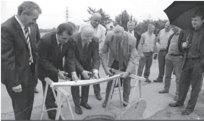
Wstęgę przecięto w punkcie, gdzie łączą się sieci krakowska i gminy Zielonki – ul. Batowicka w Krakowie i Węgrzce gm. Zielonki