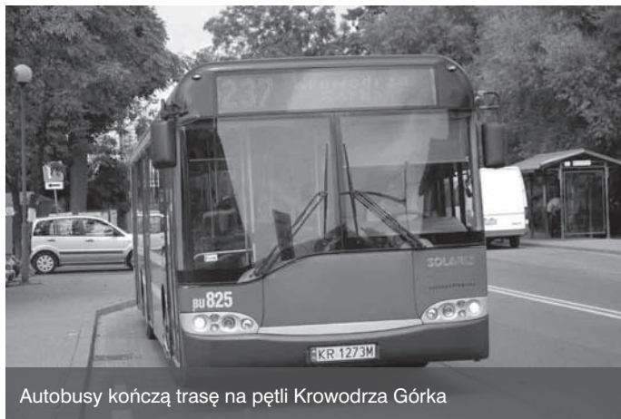
Autobusy kończą trasę na pętli Krowodrza Górka