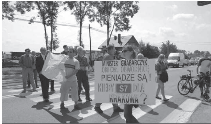
Kierowcy cierpliwie czekali, a niektórzy nawet wyrazili poparcie dla protestujących.

Na podst. „Informacji o działalności Wójta Gminy Zielonki w 2010 r.” sporcz. IO