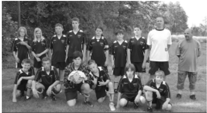
Drużyna TS Węgrzce – zwycięzcy sezonu 2010-2011