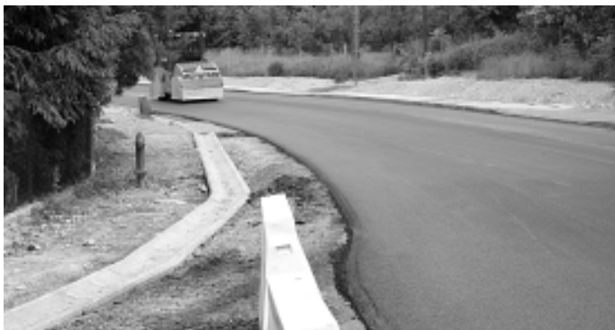
Remont drogi skorelowano z budową odcinka kanalizacji