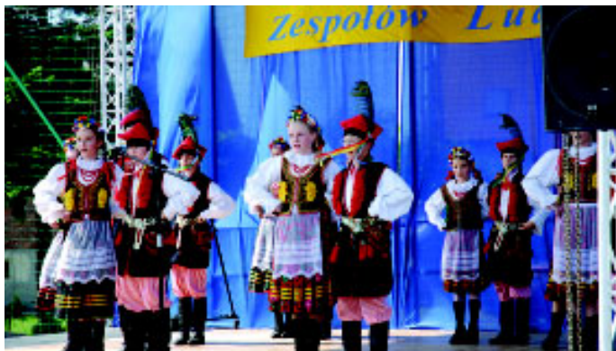
Wystąpiły zespoły: „Radziejki”...