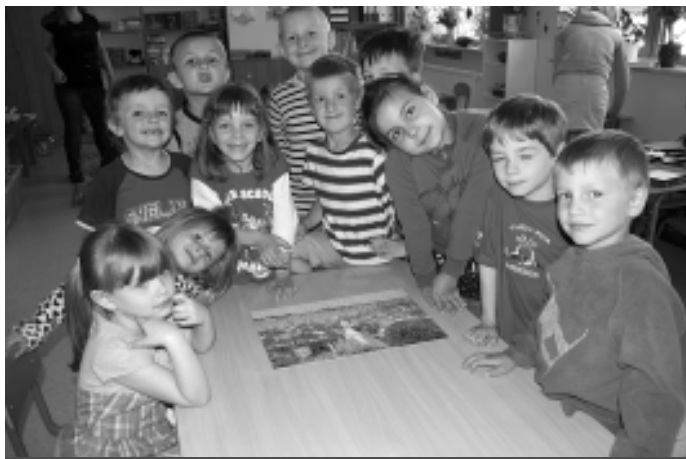
Liczba dzieci w samorządowych przedszkolach wzrosło o ok. 100