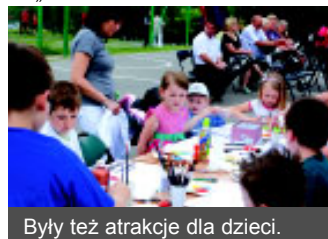
Były też atrakcje dla dzieci.