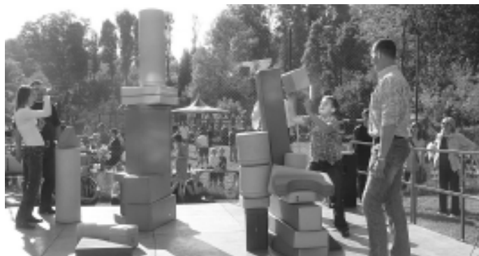
Wśród atrakcji też był turniej, w którym rywalizowały rodziny