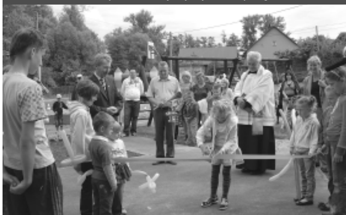
Plac zabaw w Garlicy Murowanej to już jedenasty w gminie