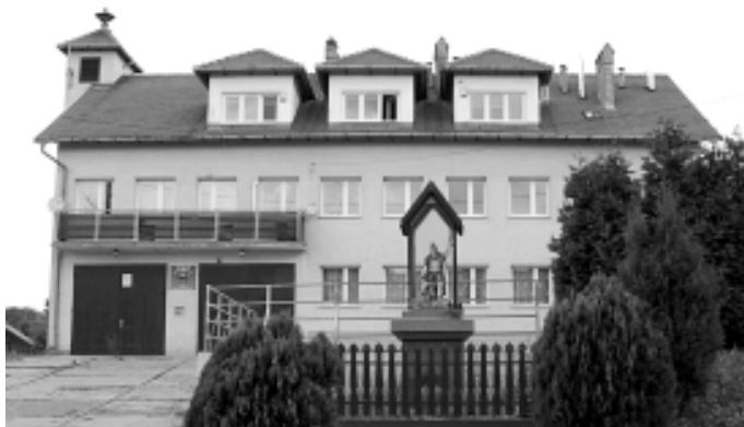
Wkrótce zmieni się otoczenie remizy w Woli