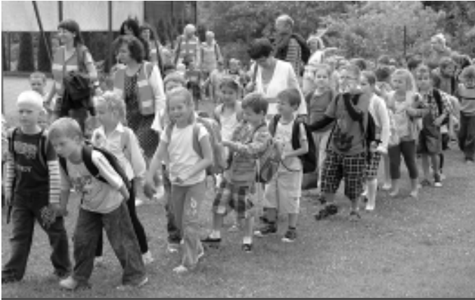
Ćwiczenia odbyły się w placówce oświatowej w Zielonkach