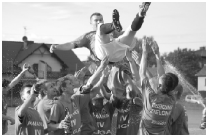
Zieleńczanka świętuje zwycięstwo i awans do IV ligi