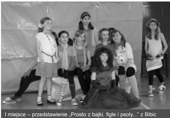
I miejsce – przedstawienie „Prosto z bajki, figle i psoty...” z Bibic