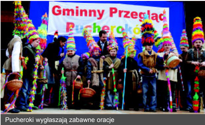
Pucheroi wygłaszają zabawne oracje