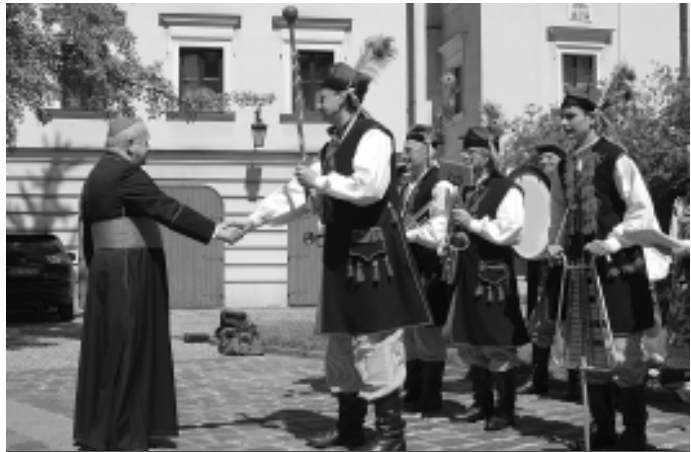
Orkiestra zagrała dla ks. kardynała Stanisława Dziwisza