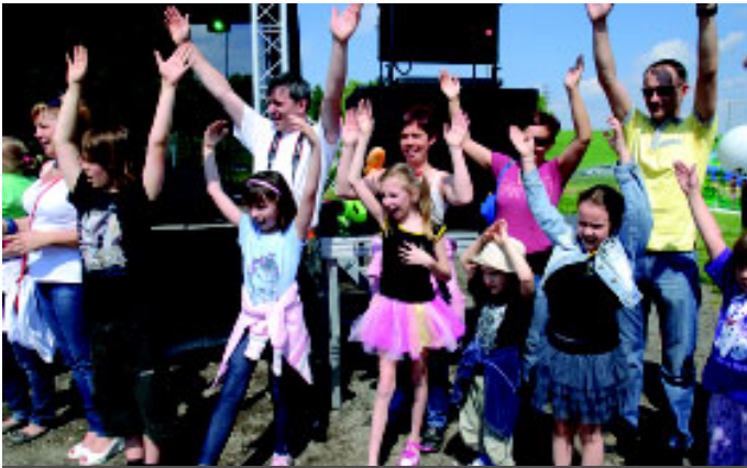
Dzień Dziecka świętowały nie tylko dzieci