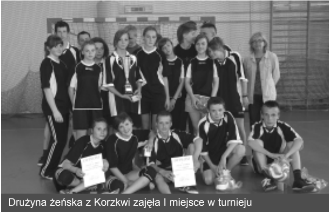
Drużyna żeńska z Korzki zajęła I miejsce w turnieju