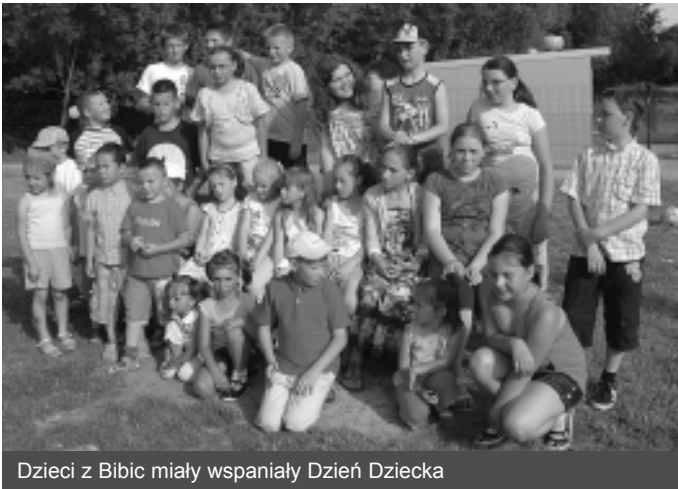
Dzieci z Bibic miały wspaniałą Dzień Dziecka