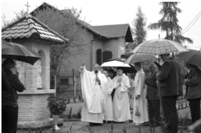
Przebudowa skrzyżowania wymagała przeniesienia kapliczki