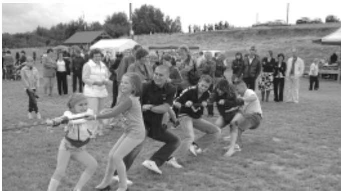
Przeciąganie liny wzbudziło wiele emocji