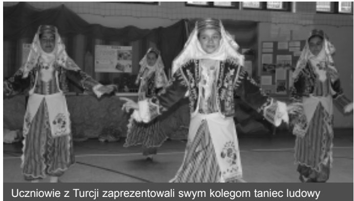
Uczniowie z Turcji zaprezentowali swym kolegom taniec ludowy