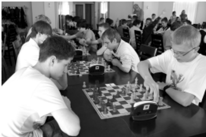
Turnieje szachowe cieszą się dużym powodzeniem