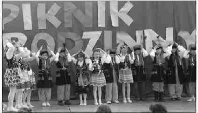
Uczniowie m.in. zatańczyli krakowiaka

w konkurencjach były różnorodne: począwszy od dzieci i młodzieży, skończywszy na reprezentacji z Rady Sołeckiej z Brzozówki, za udział wszyscy otrzymali pamiątkowe medale. Na uczestników pikniku czekały kielbaski z grilla, lody włoskie oraz dmuchane atrakcje i trampolina do skakania. Najbardziej cieszyli się chłopcy, którzy wyjeżdżali się do woli na quadach elektrycznych. Sporym zainteresowaniem cieszyło się szkolenie w zakresie udzielania pierwszej pomocy, harcerze pokazywali i ćwiczyli na fantomie sztuczne oddychanie. Inicjatorami i organizatorami pikniku byli: Rada Sołecka Brzozówki oraz Centrum Kultury, Promocji i Rekreacji w Zielonkach, imprezę wspierał Hufiec Podkrakowski im. Krakowskich Szarych Szeregów Szczep „Zielony”. KŻ