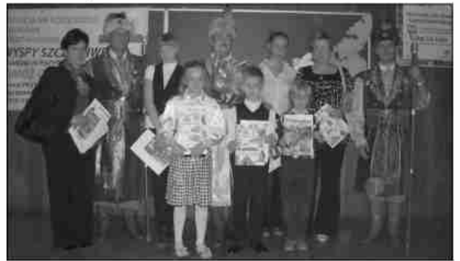
Laureaci ogólnopolskiego konkursu plastycznego

Nagrodzone i wyróżnione prace będzie można oglądać na pokonkursowych wystawach: 6-31 lipca 2009 r. w Urzędzie Miasta Krakowa, 1-31 sierpnia 2009 r. w siedzibie Zarządu Głównego Polskiego Klubu Ekologicznego w Krakowie, a od 15 września 2009 r. w Galerii Kuratorium Oświaty w Krakowie. IO