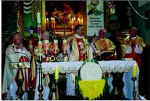
Msza Św. miała bogatą oprawę

9 maja uroczystie otwarto budynek Centrum Integracji Społecznej przy ul. Galicyjskiej w Zielonkach. Otwarciu było połączone z Dniem Strażaka Komendy Miejskiej PSP, dzięki czemu dokonane zostało w asyście jednostek państwowej i ochotniczej straży pożarnej. Komenda Miejska PSP po raz pierwszy w historii świętowała Dzień Strażaka poza Krakowem. Strażacy, przybyli na uroczystość połączoną z otwarciem Centrum Integracji Społecznej, otrzymali medale, dyplomy i awanse.