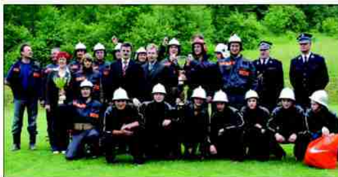
Zwycięzcy z OSP z Bosutowa w pełnym składzie

W gminie Michałowice młodzi reprezentanci Węclawic pokonali za wodników z Wilczkowie, zaś wśród seniorów w gminie Michałowice najlepsi okazali się strażacy z Książniczkek, drugie miejsce zajęli drubowie z Raciborowice, a trzecie z Michałowice, na następnych pozycjach uplasowały się reprezentacje Wilczkowie i Węclawice.