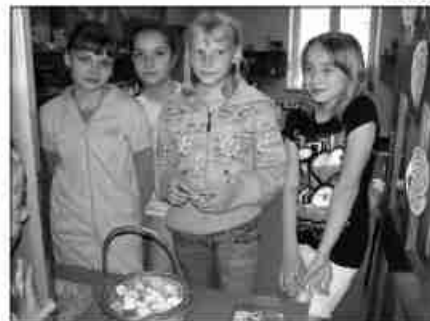
Na loterii każdy los wygrywał