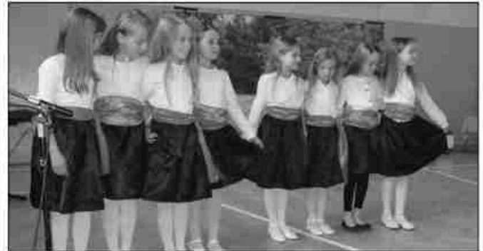
Liczne występy odbyły się w sali gimnastycznej