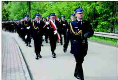
Przemarsz jednostek straży pożarnej z kościoła na teren CIS