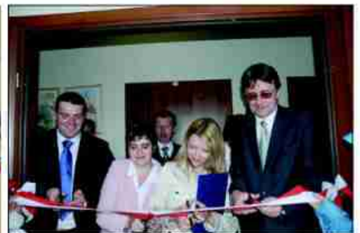
Zapraszamy do biblioteki w Zielonkach