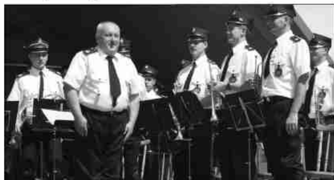
Orkiestra „Wola” zajęła II miejsce

Prócz tego 21 czerwca Parafialno – Gminna Orkiestra Dęta z Zielonek zagrała podczas XXXII Małopolskiego Festiwalu Orkiestr Dętych „Echo Trombity”, na którym zaprezentowało się aż 37 orkiestr z terenu województwa małopolskiego i zajęła tam II miejsce. O udziale orkiestry z Zielonek zdecydowało jury typując do festiwalu zdobywców trzech pierwszych miejsc międzypowiatowego przeglądu orkiestr w Wieliczce, który miał miejsce 17 maja. MKF, IO