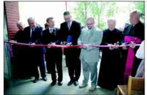
Przecięcie wstęgi w pomieszczeniach dla pogotowia ratunkowego