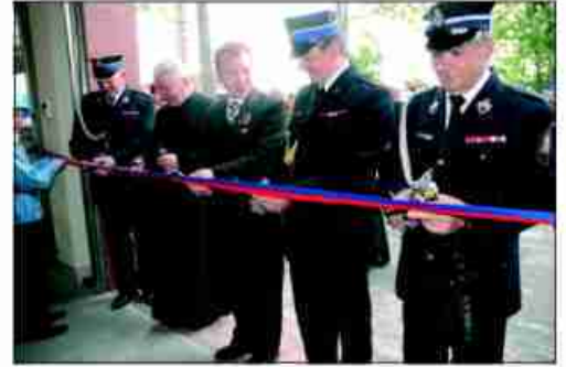
Uroczyste otwarcie remizy OSP w Zielonkach