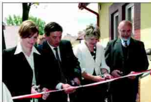
Budynek administracyjny dla GOPS i GZEAS otwarty