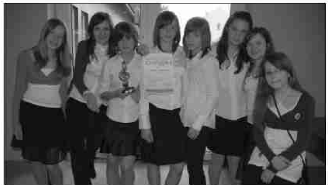
Zespół ze szkoły w Woli Zachariaszowskiej zdobył I miejsce