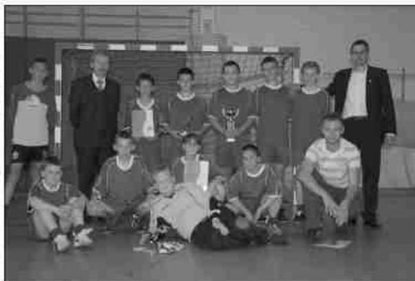
LKS Zieleńczanka była liderem sezonu