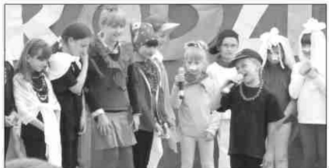
I miejsce zajęło przedstawienie ze szkoły w Korzkwi