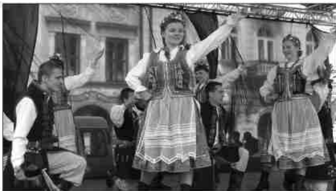
Nasz nowy zespół ludowy – „Bibiczanie”