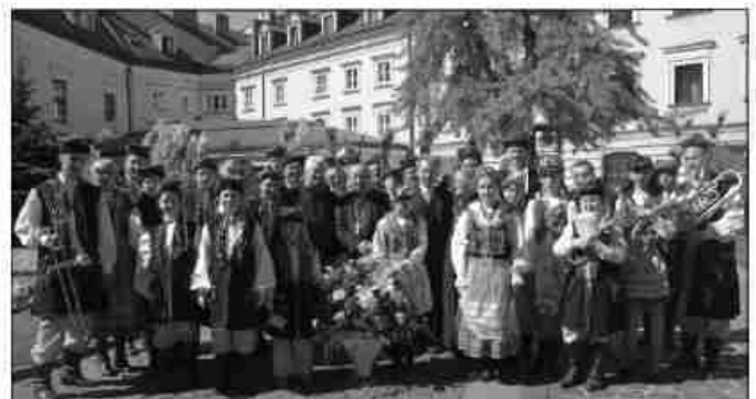
Orkiestra z Zielonek u kardynała S. Dziwisza

Ksiądz kardynał obchodził niedawno 70. urodziny, stąd życzenia były jeszcze gorętsze. IO