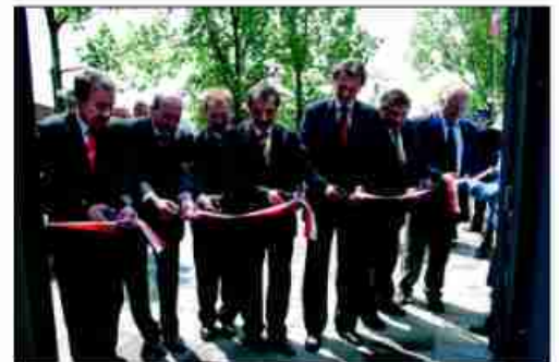
Otwarcie budynku głównego CIS