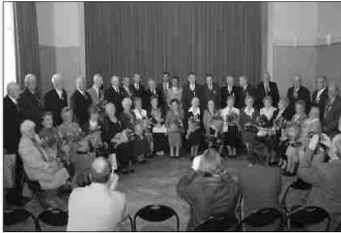
„Złote Gody” kwietowało 18 par