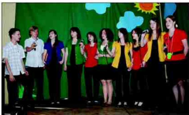
Śpiewa Fermata – grupa starsza

Nie brakuje jednak w repertuarze Fermaty znanych i lubianych polskich utworów. Soliści i cała Fermata nie stronią również od utworów anglojęzycznych, np. z repertuaru Louisa Armstronga.