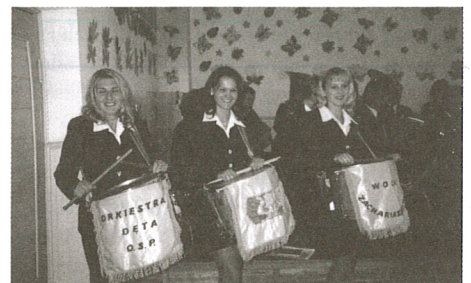
Dziewczyny z Orkiestry Dętej OSP Wola Zachariaszowska