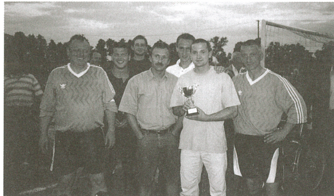
Jubilaci z okazałym pucharem

Największym sportowym sukcesem klubu z Zielonek była gra w klasie okręgowej w latach 1994-96. W następnych latach, niestety, Zieleńczanka spadła aż o dwie klasy rozgrywkowe do klasy B. Rok temu drużyna awansowała do klasy A i w tejże klasie występuje także w obecnym sezonie. Klub jest dotowany przez Urząd Gminy Zielonki oraz wspierany przez drob-