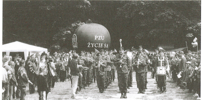
Defiluje wojskowy zespół „Czasza”

Już na stałe zadomowiły się w Korzkwi imprezy organizowane przez Stowarzyszenie Pomocy Dzieciom Niepełnosprawnym „Bądźcie z nami”.