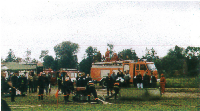
Strażacy w akcji