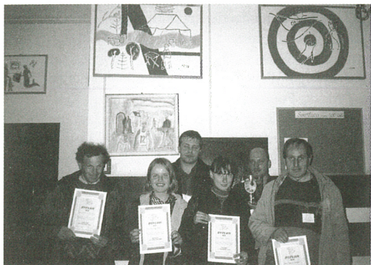
Uczestnicy wakacyjnych zajęć

Zajęcia wakacyjne zaczęły się już w czerwcu od II Plenarowych Warsztatów Arteterapii, zorganizowanych a n y c h przez Stowarzyszenie Przyjaciół Domu P o m o c y Społecznej w Owczarach. Choć pogoda nie dopisała w s z y s c y