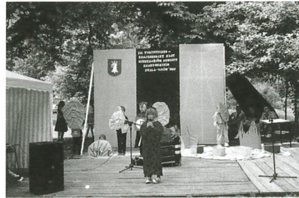
Dzieci ze SP w Owczarach w spektaklu „Cztery misie”