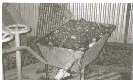
Do oczyszczalni oprócz ścieków spływają różne wspaniałości ...

Podobno jesteśmy cywilizowanym narodem, a jak Polska długa i szeroka, Polak duży i mały wrzuca do rur kanalizacyjnych co popadnie. Stare ciuchy, gazety, resztki jedzenia, podpaski, resztki zastawy stołowej, a nawet sztuczne szczęki. Rodacy, tego nie wytrzyma żadna, nawet super nowoczesna oczyszczalnia ścieków! Używajmy muszli i zlewów zgodnie z przeznaczeniem. A odpady wrzucajmy do kosza!