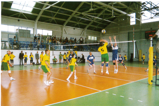
Mecz siatkówki gmina Zielonki kontra Urząd Marszałkowski

Po części oficjalnej, a przed głównymi atrakcjami przygotowanymi dla naszych gości, jakimi tego dnia były dwa mecze: siatkówki pomiędzy drużynami Urzędu Marszałkowskiego a gminy Zielonki oraz piłki nożnej pomiędzy aktorami scen krakowskich a dziennikarzami z Dzien-