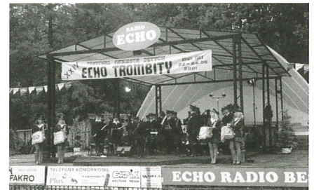
Występ orkiestry w Nowym Sączu

Festiwal był realizowany w dwóch etapach: II międzypowiatowych eliminacji w Wieliczce (10 czerwca) i spotkaniach finałowych, które odbyły się w dniach 22-24.06. W eliminacjach powiatowych wzięło udział siedem orkiestr z trzech powiatów, wśród których były m.in. orkiestry zakładowe, strażackie, parafialne i szkolne. Do Nowego Sącza pojechały dwie orkiestry w tym