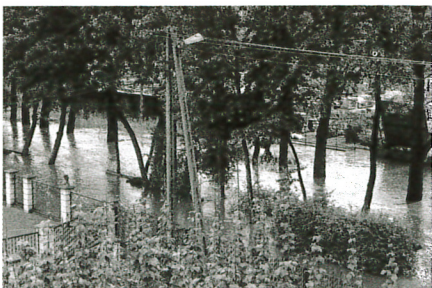
Woda z rzek zalewała okoliczne posesje

W Zielonkach woda nieznacznie podmyła brzeg rzeki przy ul. Bankowej. Brzeg musiał zostać umocniony faszyną. W trakcie akcji rozdanych zostało około 150 worków, które przy pomocy mieszkańców piaskiem napełniali strażacy i układali na poboczu wzdłuż drogi. Mimo tego częściowo zalane zostały piwnice, garaże, ogrody oraz studnie przydomowe. Strażacy na bieżąco wypompowali i chlorowali wodę w zalanych studniach. Wystąpiono ponadto do Państwowego Inspektora Sanitarnego