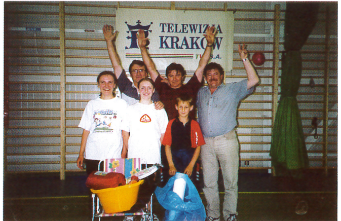
Zwycięzcy „Pięcioboju sołeckiego” - reprezentacja Zielonek

Imprezę o godz. 14.00 otwarł wójt Bogusław Król wraz z przewod-