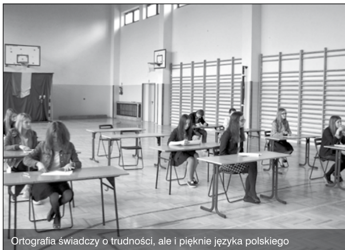
Ortografia świadczy o trudności, ale i pięknie języka polskiego