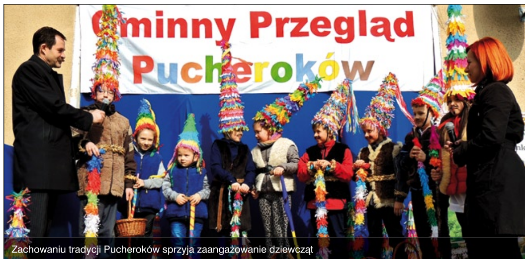
Zachowaniu tradycji Pucheroków sprzyja zaangażowanie dziewcząt