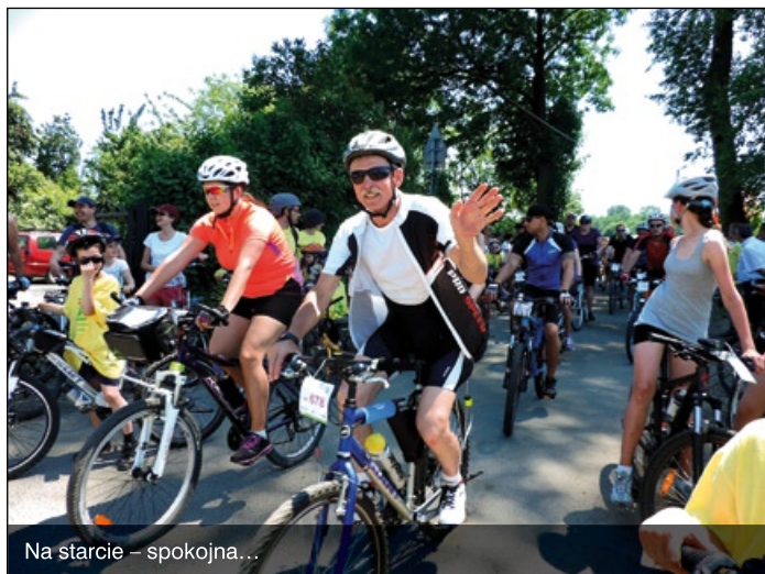
Na starcie – spokojna...