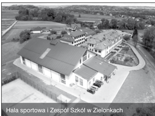
Hala sportowa i Zespół Szkół w Zielonkach

Co szczególnie się udało, co można uznać za największe osiągnięcie?