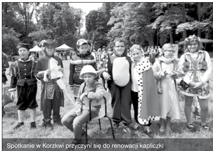
Spotkanie w Korzkwi przyczyni się do renowacji kapliczki