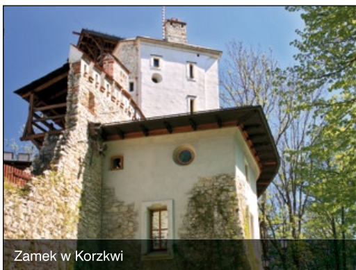
Zamek w Korzkwi