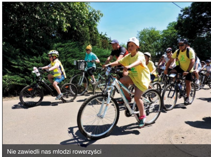
Nie zawiedli nas młodzi rowerzyści

to wina i samej pogody, gorąco, bo wydawało mi się, że forma całkiem niezła, a trzeba będzie jeszcze popracować – śmiała się jedna z uczestniczek rajdu, mieszkanka Krakowa.