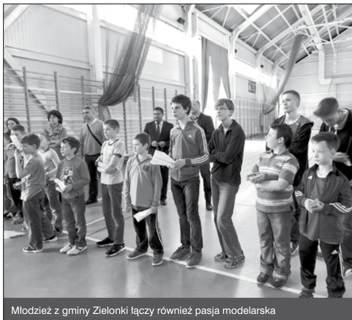
Młodzież z gminy Zielonki łączy również pasja modelarska