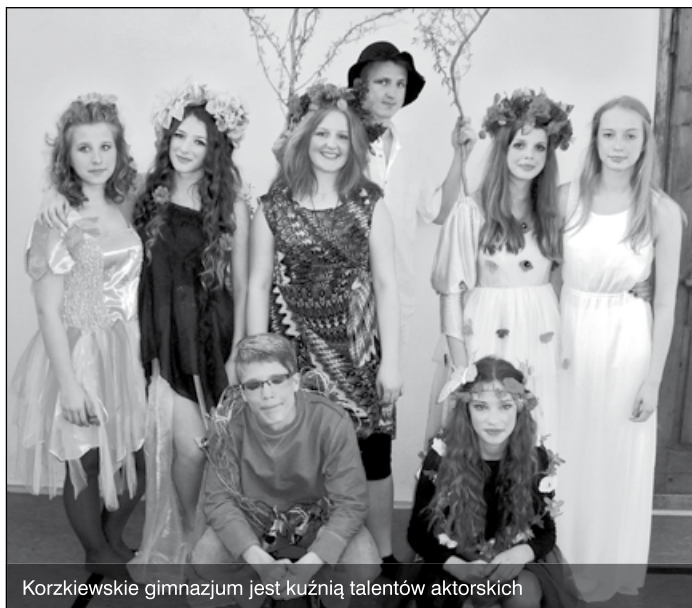
Korzkiewskie gimnazjum jest kuźnią talentów aktorskich