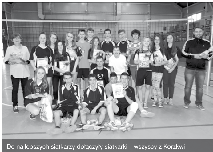
Do najlepszych siatkarki dołączyły siatkarki – wszyscy z Korzkwi