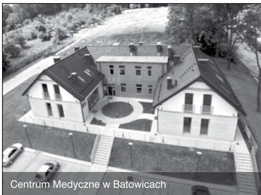
Centrum Medyczne w Batowicach

W tym ćwierćwieczu powstała praktycznie od zera cała łażniejsza baza oświatowa gminy Zielonki. Wybudowano nowe budynki oświatowe: w Korzkwi (1993–1994), Woli Zachariaszowskiej (1996), Zielonkach (I łażon: 1997, hala sportowa: 2001, II łażon: 2009), Bibicach (2004), wyremontowano budynek w Owczarach, w 2005 roku przedszkole z Węgrzyc przeniesiono do wyremontowanego budynku małej szkoły w Bibicach, a w 2007 roku wykonano gruntowny remont przedszkola w Trojanowicach, który w 2014 roku nakładem prywatnego inwestora z pomocą gminy został rozbudowany o nowy łażon. Wyniki uczniów z gminy Zielonki z testów kompetencyjnych klas VI i egzaminów gimnazjalnych w roku 2013, 2014 i 2015 były najlepsze w Małopolsce.