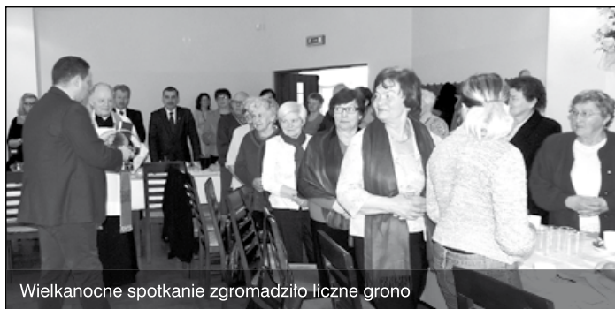
Wielkanocne spotkanie zgromadziło liczne grono