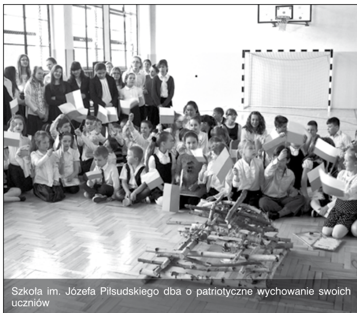
Szkola im. Józefa Piłsudskiego dba o patriotyczne wychowanie swoich uczniów