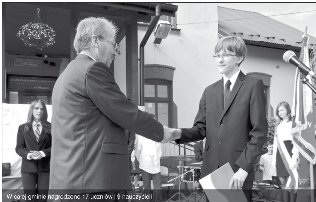
W całej gminie nagrodzono 17 uczniów i 9 nauczycieli