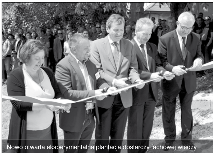
Nowo otwarta eksperymentalna plantacja dostarczy fachowej wiedzy