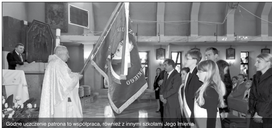
Godne uczczenie patrona to współpraca, również z innymi szkołami Jego Imienia