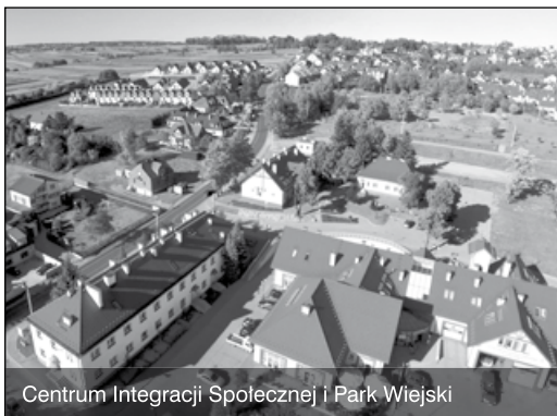
Centrum Integracji Społecznej i Park Wiejski

W latach 1996–1997 gmina wdrożyła instytucję lekarza rodzinnego dla wszystkich mieszkańców, powstało osiem niepublicznych ZOZ, utworzono dwa gabinety stomatologiczne. Zmodernizowano obiekty ośrodków zdrowia w Batowicach, Węgrzycach, Zielonkach i wybudowano nowy w Brzozówce. Bazę medyczną uzupełniają dwa zespoły wyjazdowe pogotowia ratunkowego ulokowane w gminnych budynkach: w Węgrzycach i Zielonkach. Niestety, od 1999 roku gmina z mocy ustawy przestała koordynować i finansować podstawową opiekę zdrowotną. Pomimo to nakładem finansowym gminy w 2014 roku otwarto nowoczesny budynek Centrum Medycznego w Batowicach.