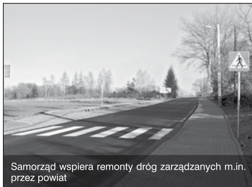
Samorząd wspiera remonty dróg zarządzanych m.in. przez powiat

Sieć wodociągowa na terenie gminy obejmuje ponad 95 proc. jej powierzchni, sieć kanalizacyjna liczy 190 km, pokrywa ponad 80 proc. gminy – to jeden z najwyższych wskaźników w Małopolsce. Zadania kanalizacyjne finansowane są przy współudziale środków europejskich (Program Operacyjny Infrastruktura i Środowisko). Od 2010 roku na budowę sieci kanalizacji i wodociągów w gminie Zielonki wydano prawie 53,5 mln złotych, z czego ponad 29,5 mln pochodziło z funduszy unijnych. Nadal prowadzone są dwie duże inwestycje kanalizacyjne.