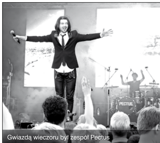
Gwiazdą wieczoru był zespół Pectus