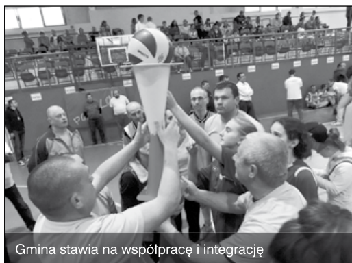
Gmina stawia na współpracę i integrację

W 1999 r. gmina przekazała budynek komunalny do użytkowania policji, przeprowadzono jego adaptację na potrzeby Komisariatu Policji w Zielonkach, gmina jest fundatorem trzech samochodów używanych przez komisariat. Od 1990 roku trzy jednostki OSP przeprowadziły się do nowych remiz, czwarta remiza jest w budowie, pozostałe były sukcesywnie modernizowane. Gmina współfinansowała zakup samochodów pożarniczych, od 2009 roku czterech nowych, trzy jednostki OSP funkcjonują w Krajowym Systemie Ratowniczo-Gaśniczym.