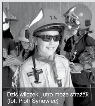
Dzisiaj wilczek, jutro może strażak