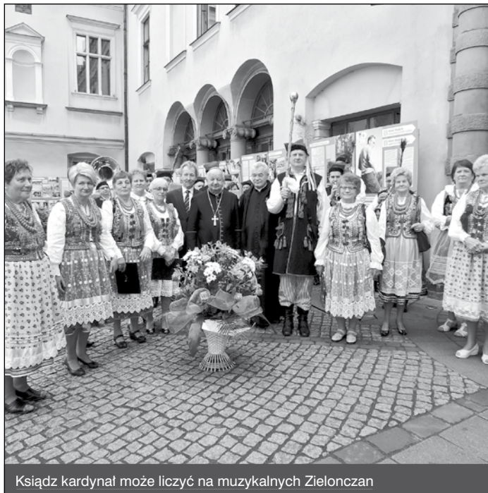
Ksiądz kardynał może liczyć na muzykalnych Zielonczan