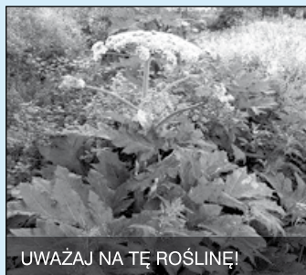
UWAŻAJ NA TĘ ROŚLINĘ!

Ma silne działanie toksyczne i alergizujące, wydziela parzącą substancję, która może powodować zapalenie skóry, powstawanie pęcherzy i trudno gojących się ran. Jego parzące działanie nasila się podczas słonecznej pogody, wysokiej temperatury oraz dużej wilgotności powietrza. W skrajnych przypadkach kontakt z rośliną może zakończyć się nawet śmiercią. Zaleca się zwalczanie Barszczu Sosnowskiego poprzez mechaniczną wycinkę całych roślin, a w szczególności kwiatostanów w fazie kwitnienia, przed zawiązaniem nasion, tak aby nie dopuścić do ich dalszego rozsiewania oraz poprzez opryskiwanie roślin preparatami chemicznymi. Chemiczny oprysk zaleca się stosować przynajmniej dwa razy w roku, gdyż pomimo żółknięcia spryskanych roślin, często następuje ponowny rozwój pędów. Apelujemy o wykaszanie działek prywatnych oraz walkę z tym chwastem, gdyż tylko wspólnymi siłami możemy go zniszczyć.