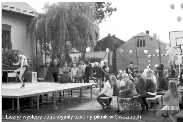
Liczne występy uatrakcyjniły szkolny piknik w Owczarach