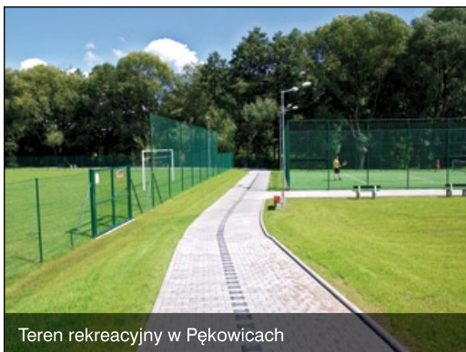
Teren rekreacyjny w Pękowicach