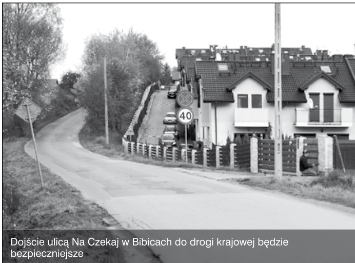
Dojście ulicą Na Czekaj w Bibicach do drogi krajowej będzie bezpieczniejsze