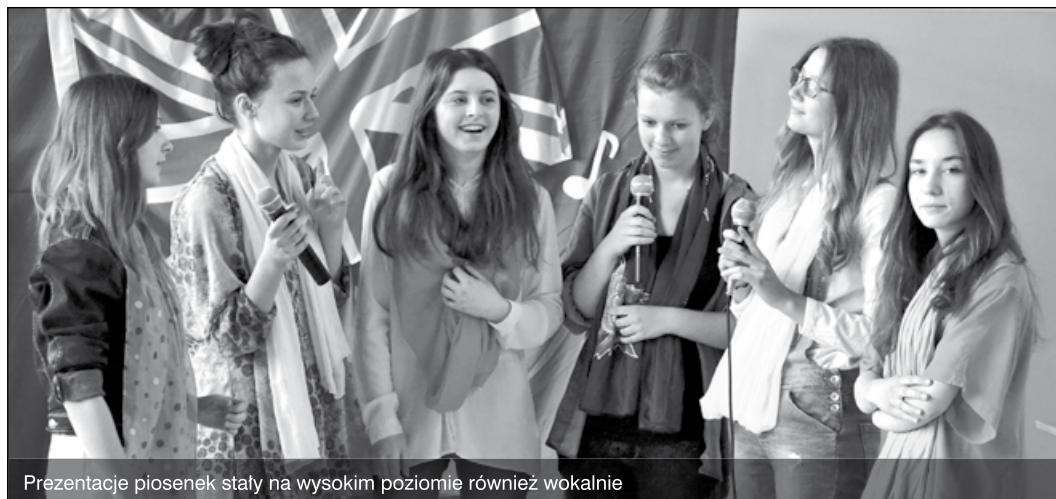
Prezentacje piosenek stały na wysokim poziomie również wokalnie