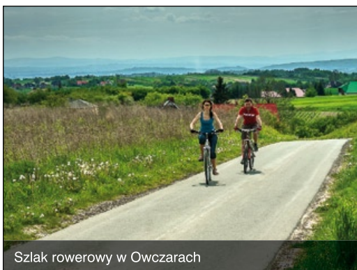
Szlak rowerowy w Owczarach