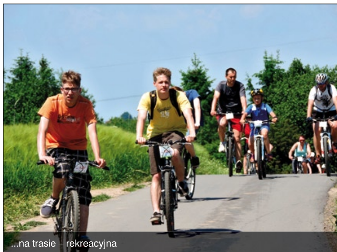
...na trasie – rekreacyjna