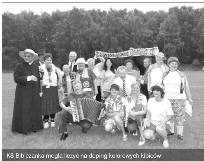
KS Bibiczanka mogła liczyć na doping kolorowych kibiców