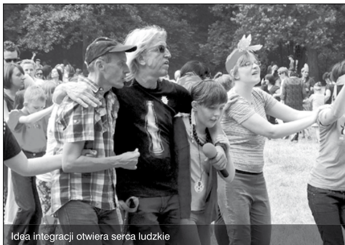
Idea integracji otwiera serca ludzkie