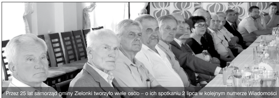
Przez 25 lat samorząd gminy Zielonki tworzyło wiele osób – o ich spotkaniu 2 lipca w kolejnym numerze Wiadomości

Niewątpliwą jego zasługą w obu kadencjach było stworzenie niemal od podstaw infrastruktury oświatowej oraz pionierska na tamte czasy reforma służby zdrowia, w tym wprowadzenie instytucji lekarza rodzinnego dla wszystkich mieszkańców. Powołano do życia Gminny Ośrodek Pomocy Społecznej oraz Samorządowy Ośrodek Kultury. Zbudowano sieć telefoniczną, zmodernizowano część infrastruktury technicznej.