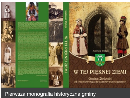
Pierwsza monografia historyczna gminy