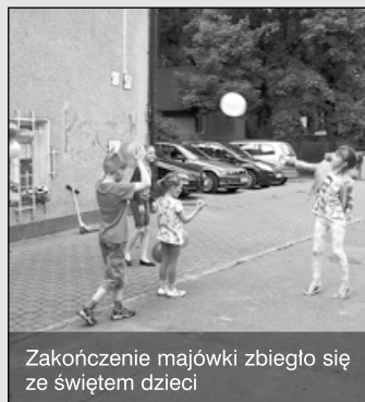
Zakończenie majówki zbiegło się ze świętem dzieci