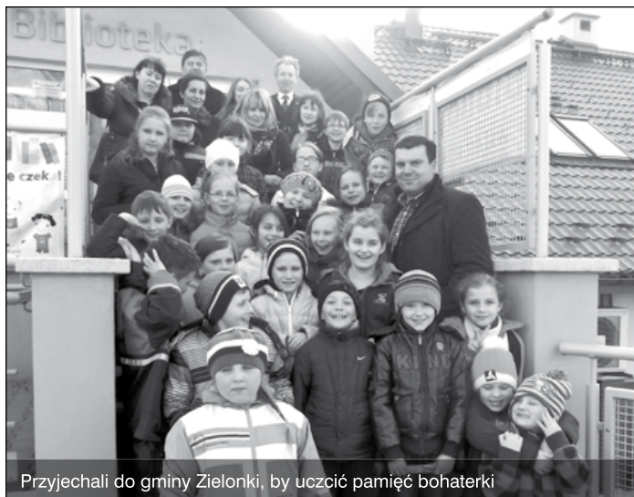
Przyjechali do gminy Zielonki, by uczcić pamięć bohaterki