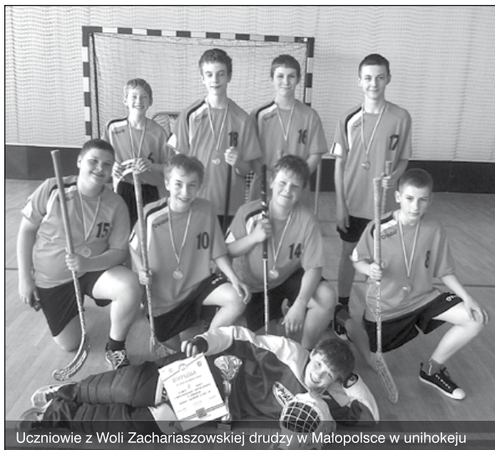
Uczniowie z Woli Zachariaszowskiej drużyny w Małopolsce w unihokeju