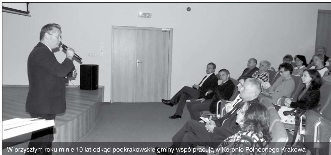
W przyszłym roku minie 10 lat odkąd podkrakowskie gminy współpracują w Koronie Północnego Krakowa