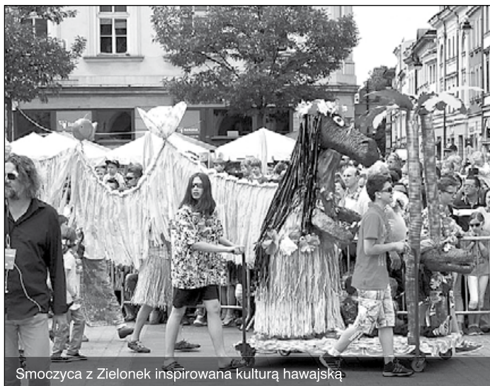
Smoczyca z Zielonek inspirowana kulturą hawajską