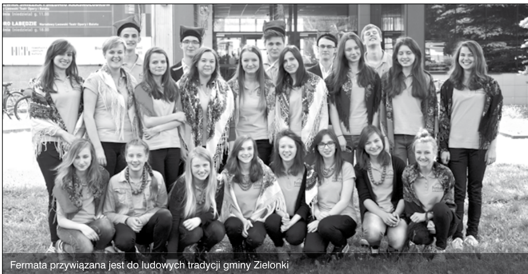
Fermata przywiązana jest do ludowych tradycji gminy Zielonki