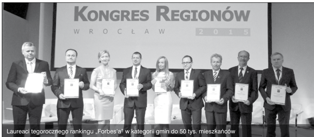
Laureaci tegorocznego rankingu „Forbes’a” w kategorii gmin do 50 tys. mieszkańców