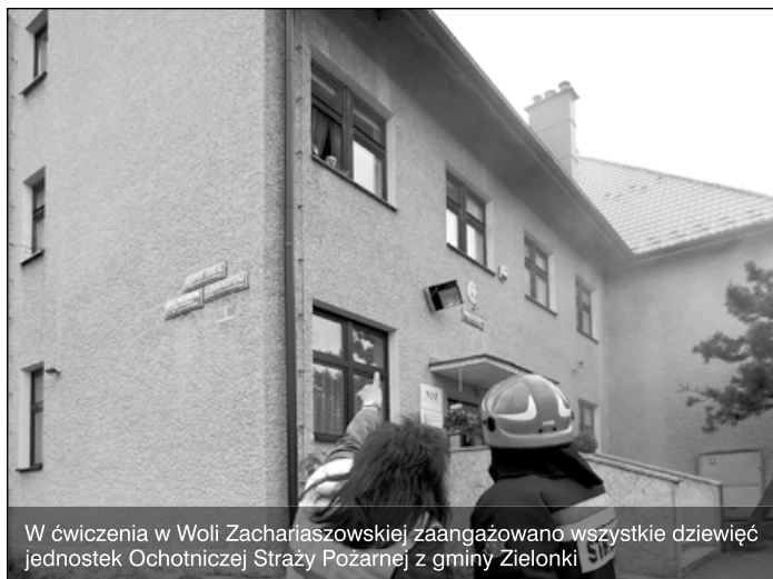
W ćwiczenia w Woli Zachariaszowskiej zaangażowano wszystkie dziewięć jednostek Ochotniczej Straży Pożarnej z gminy Zielonki