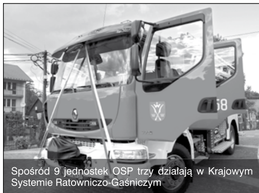
Spośród 9 jednostek OSP trzy działają w Krajowym Systemie Ratowniczo-Gaśniczym

W okresie 1990–2015 wykonano, wyremontowano i zmodernizowano ponad 104 km dróg na terenie gminy Zielonki, w tym: 70 km dróg gminnych, 21 km dróg powiatowych, 10 km dróg wojewódzkich, 3,3 km dróg krajowych. W ciągu 25 lat wybudowano ponad 11 km chodników przy drogach gminnych, dodatkowo powstawały chodniki przy drogach powiatowych, drodze wojewódzkiej i krajowej, których budowę gmina Zielonki współfinansowała w połowie.