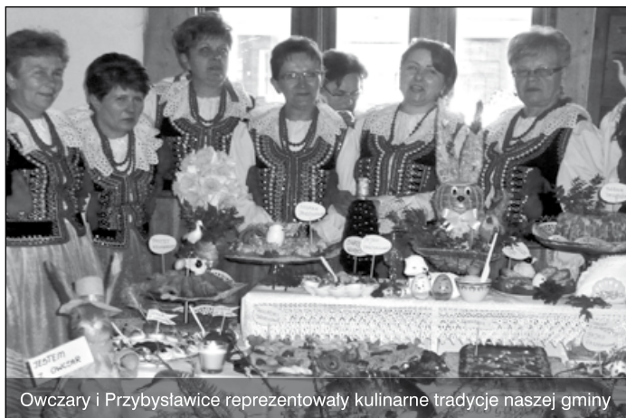
Owczary i Przybysławice reprezentowały kulinarne tradycje naszej gminy