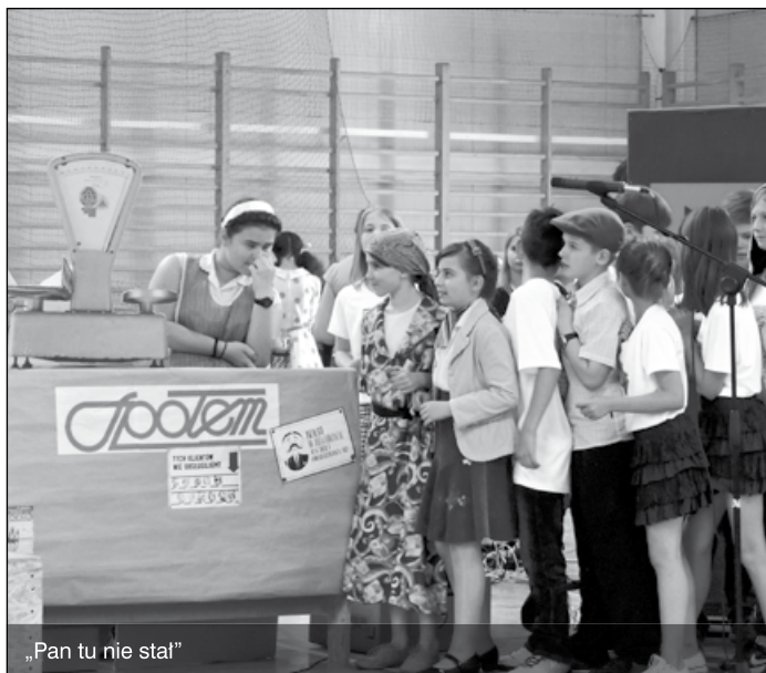
„Pan tu nie stał”