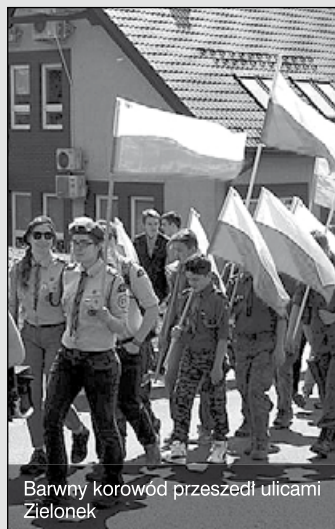
Barwny korowód przeszedł ulicami Zielonek