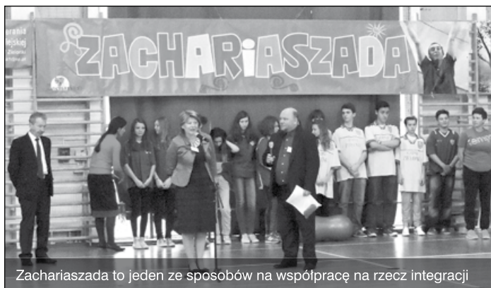
Zachariaszada to jeden ze sposobów na współpracę na rzecz integracji