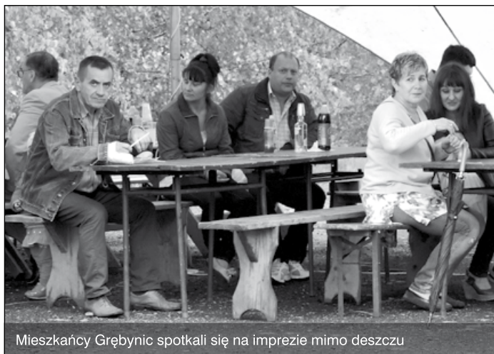
Mieszkańcy Grębynic spotkali się na imprezie mimo deszczu