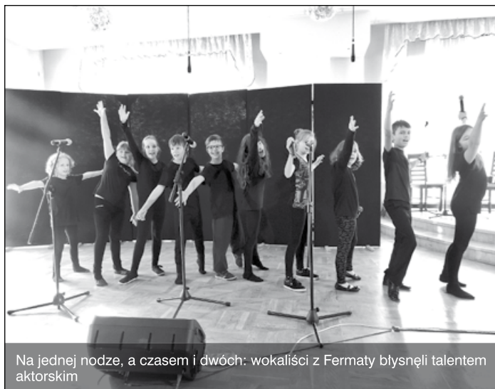
Na jednej nodze, a czasem i dwóch: wokaliści z Fermaty błysnęli talentem aktorskim