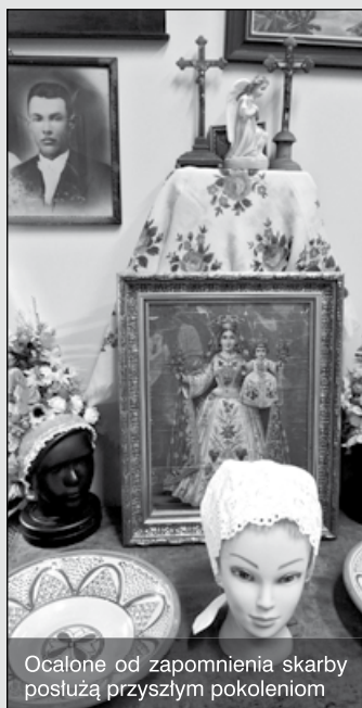
Ocalone od zapomnienia skarby posłużą przyszłemu pokoleniu