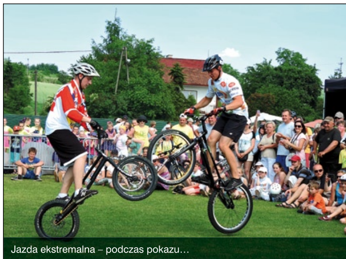
Jazda ekstremalna – podczas pokazu...