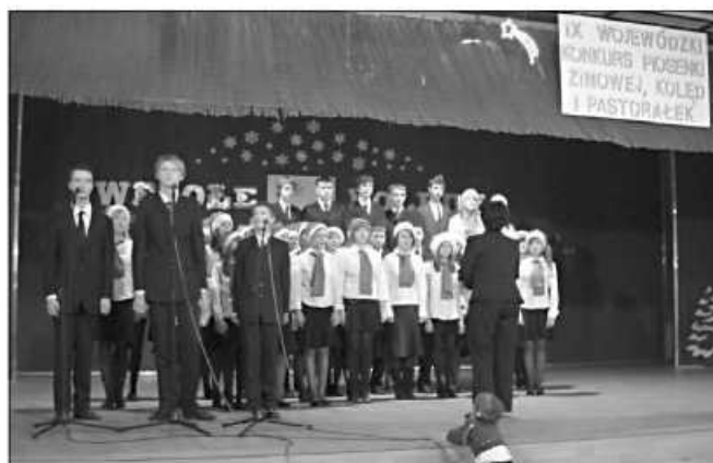
„Mezzoforte”: ma na swym koncercie kolejną nagrodę