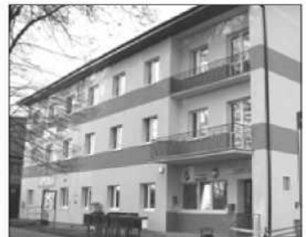
Pomimo trudności remont Centrum Medycznego dobiegł końca

Budynek został ocieplony, otynkowany, wymieniono wszystkie okna na okna PCV. W