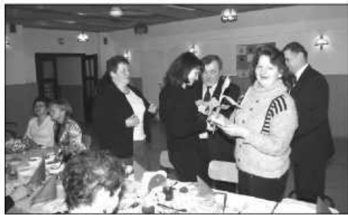
Panie w podziękcie otrzymały kwiaty

Dzień Kobiet panie z Brzozówki obchodziły pracownie. Odbyło się szkolenie kulinarne, a potem, w miłej atmosferze, spotkanie połączone z degustacją. Przygotowano m.in. roladę z indyka i cztery rodzaje sałatek.