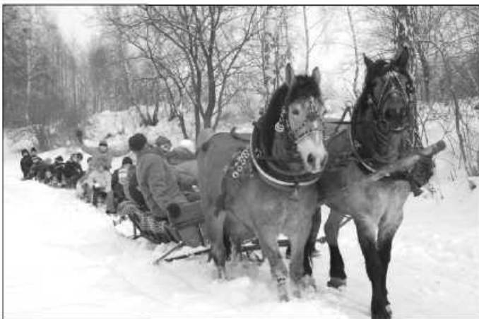
Kulig zorganizowany dla dzieci udał się wspaniale

w Korzkwi, tak że miłośnicy pięknych widoków mieli również powody do radości. Na koniec spotkania upieczono smaczne kielbaski na ognisku, dopisały apetyty i humory. Wspominano bal karnawałowy, który poprzedniego dnia miał miejsce w budynku wielofunkcyjnym, gdzie dzieci spotykały się podczas ferii. Czekają gry planszowe, logiczne, ruchowe. Można było grać w ping-ponga, jak również skorzystać z komputera i internetu. IO