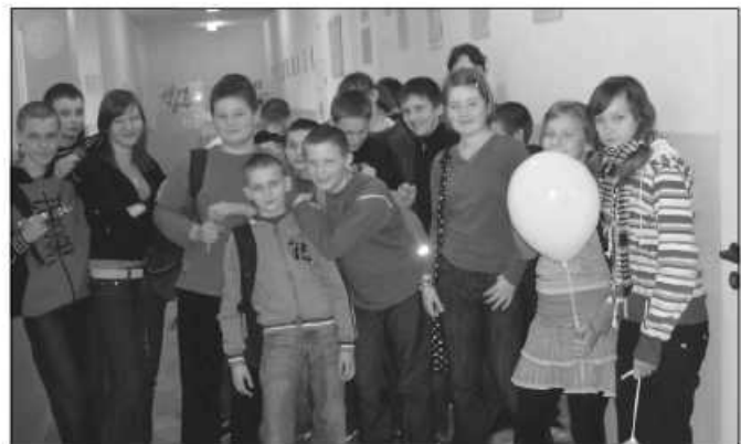
Uczniowie z Woli Zachariaszowskiej już uczestniczyli w warsztatach