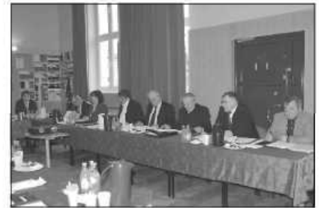
Radni podjęli uchwałę o odmowie zatwierdzenia taryf dla zbiorowego zaopatrzenia w wodę i odprowadzania ścieków

z prośbą o zmianę najemcy. Z uwagi na fakt, że nie spowoduje to zmiany charakteru działalności gospodarczej, a nowy dzierżawca przyjmuje za obowiązujące obecne warunki umowy pomiędzy gminą Zielonki a dotychczasowym najemcą, lokal zostaje wydzierżawiony na czas nieokreślony.