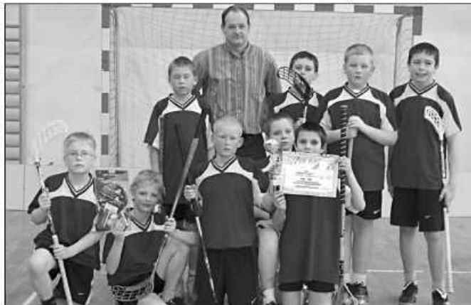
Chłopcy też zajęli I miejsce w powiecie