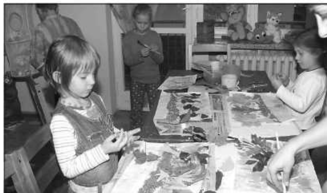
W świetlicy „Tęczowy kącik” dzieci w ciekawy sposób spędzają czas

W Węgrzcach działa nowa świetlica dla dzieci - „Tęczowy kącik” ( www.teczowykacik.pl ) prowadzona przez wykwalifikowanych nauczy-