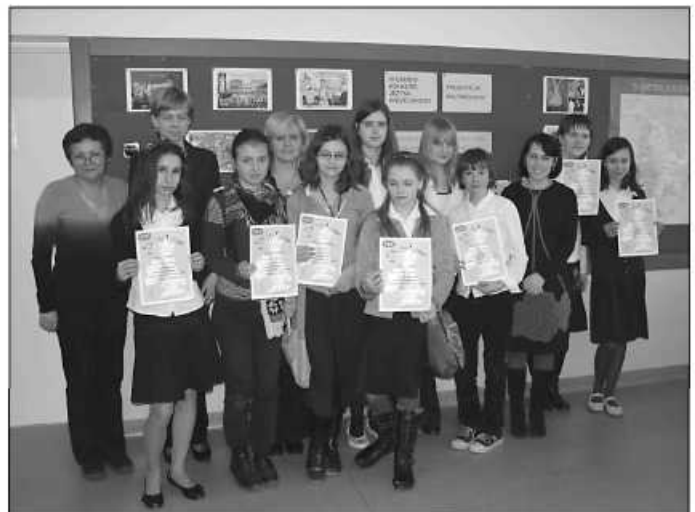
Laureaci konkursu języka angielskiego