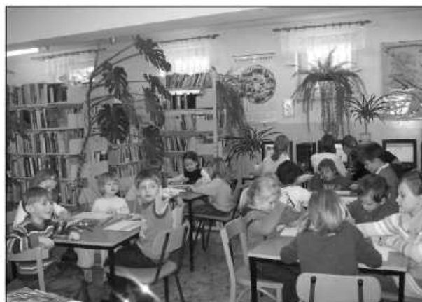
Mali goście w bibliotece na pewno się nie nudzili

wiec zrobiła uczestnikom pamiątkowe zdjęcia. Mali twórcy i czytelnicy odwiedzający bibliotekę mogli przynajmniej do końca marca obejrzeć prace na specjalnej wystawie. IO