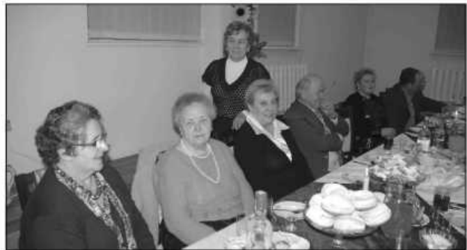
Ostatni wieczór karnawalu choć był udany, nie do końca był radosny