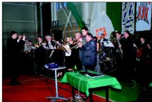
Gości witała orkiestra z Zielonek