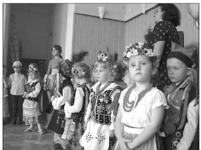
Przedszkolaki z Zielonek

Płatność za przedszkole ustalona jest przez Radę Gminy w ww. uchwale i wynosi 11 procent aktualnie obowiązującego minimalnego wynagrodzenia za pracę ustalonego zgodnie z ustawą z dnia 10 października 2002 r. o minimalnym wynagrodzeniu za pracę (Dz.U.