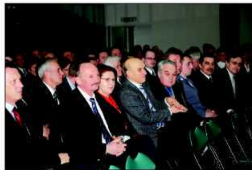
Odwiedziło nas wielu znamienitych gości