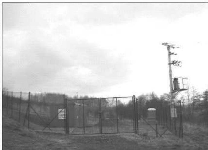
Ujęcie wody w Bosutowie

Text przygotowany we współpracy z PUK, na podstawie prezentacji przedstawi- onej radnym przez prezesa PUK Jacka Leśn- nika podczas XXV sesji RGZ.