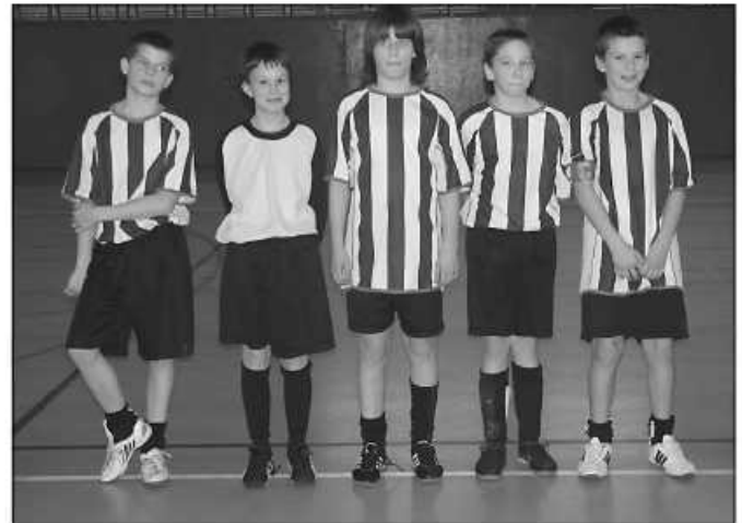
Zwycięzcy turnieju szkół podstawowych – zespół z Węgrzce