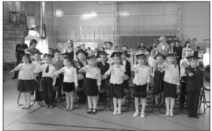
Tegoroczne pierwszaki z Zielonek. Jeszcze siedmiolatki

W szkołach w Zielonkach i Bibicach uczniowie zerówek w roku szkolnym 2009/2010 będą mogli po godzinach nauki przebywać nieodpłatnie w świetlicy szkolnej, w której znajdą się tylko dzieci sześciolatki. Jeśli zajdzie taka potrzeba, będą one miały zapewnioną opiekę do 10 godzin dziennie. – Rolą dyrektorów szkół będzie zapewnienie im ciekawych i urozmaiconych zajęć świetlicowych – podkreśla wójt. Rodzice, których dzieci będą pozostawały w placówce więcej niż 5 godzin, będą mieli możliwość wykupienia dla swej pociechy pełnego wyżywienia (śniadanie, obiad i podwieczorek) lub tylko obiadu. Szacuje się, iż koszt