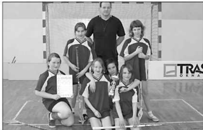
Dziewczęta z Woli drugi raz wygrały turniej powiatowy