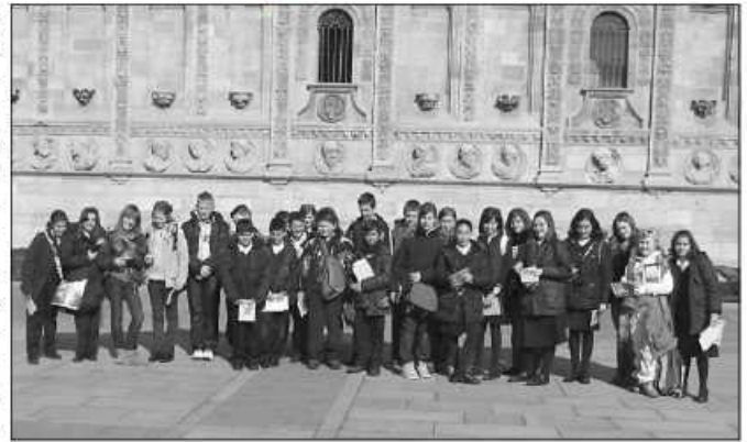
Szóstoklasiści z Korzkwi spotkali się z rówieśnikami z innych krajów

Środa upłynęła pod znakiem sportów ekstremalnych w pobliskich pięknych górach. Pod okiem instruktorów dzieci penetrowały jaskinie, strzelały z luków, wdrapywały się na ściankę wspinaczkową i chodziły na szczydach. Wieczorem, po dyskoteczce, rodziny hiszpańskie zaprosiły całą grupę comeniusową na pizzę. Siedemdziesiąt osób w jednej, niezbyt dużej pizzerii jadło, piło i strasznie hałasowało. O dziwo, nikomu to nie przeszkadzało. Hiszpanie