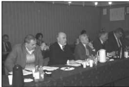
Radni zdecydowali o przystąpieniu do projektu „Demontaż i bezpieczne składowanie wyrobów zawierających azbest”