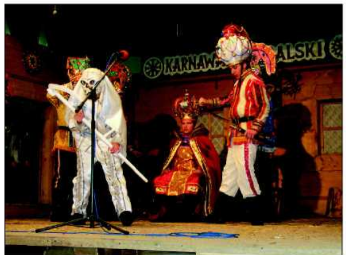
Herody nagrodzono II miejscem podczas XXVII Karnawału Góralskiego w Bukowinie