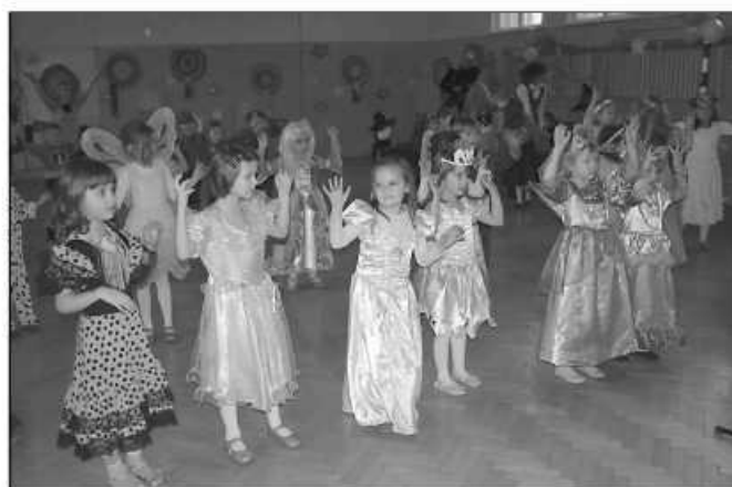
W przedszkolu w Bibicach na balu bawiono się świetnie