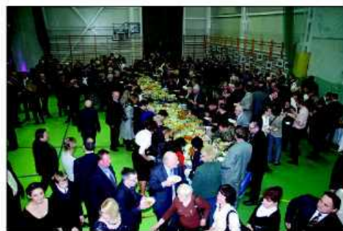
Był i czas na rozmowy przy śledziku i nie tylko...