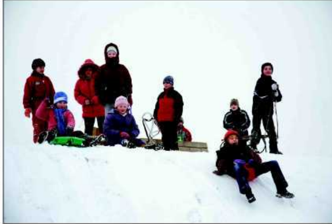
Ferie z CKPiR w Zielonkach - były zabawy na górze w parku wiejskim i wyprawa na lodowisko