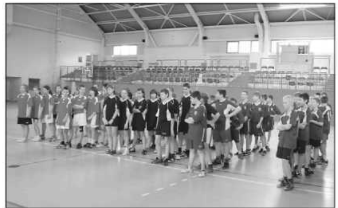
Najlepsze okazały się dziewczęta z Bibic i chłopcy z Zielonek