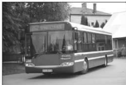
267 do Krakowa pojedzie dodatkowo o 10.45 i 12.30

Utrzymanie linii 267 w 2009 r. będzie kosztowało gminę Zielonki ok. 280 tys. zł. Łącznie na dopłaty do MPK gmina Zielonki wyda w 2009 r. ze swego budżetu 1 mln 150 tys. zł. Przez teren gminy Zielonki prowadzi 10 linii MPK.