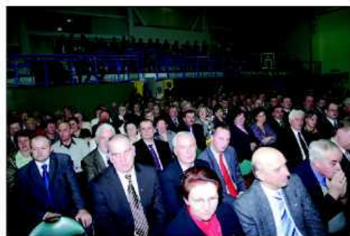
W ostatni dzień karnawału hala była wypełniona gośćmi