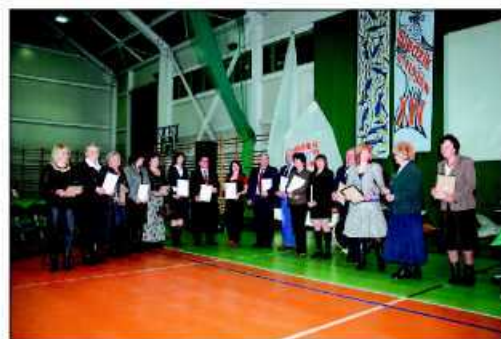
„Śledzik” był też okazją do podziękowania sponsorom imprez kulturalnych