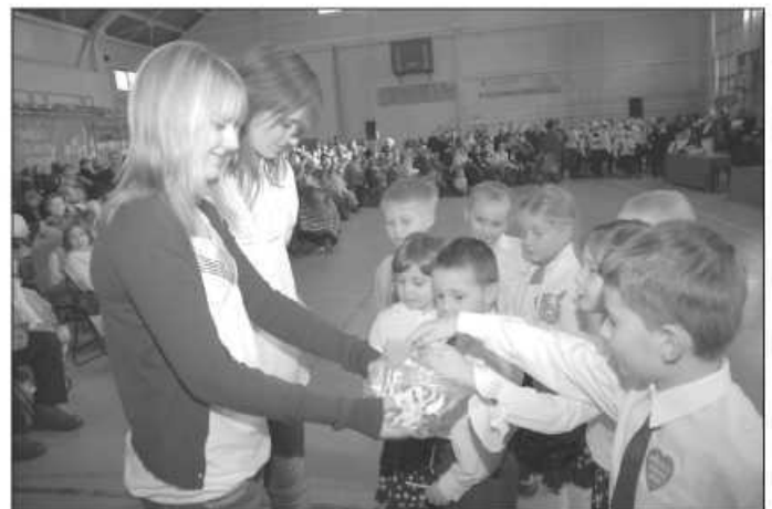
Wszyscy zegrali w Wielkiej Orkiestrze