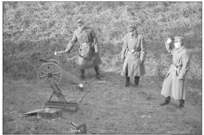
Na pamiątkę historycznych wydarzeń oddano ogień z repliki dział z 1863 r.