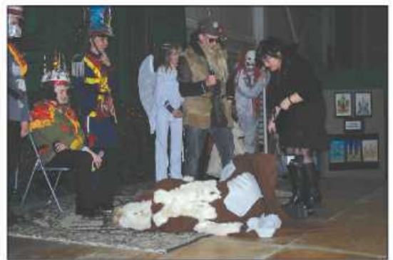
Herody z Minogi - młodzieżowa werwa i radość na scenie