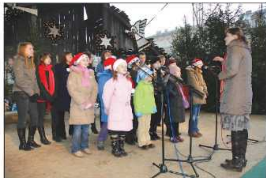
Zespół Wokalno-Instrumentalny Fermata

Gmina Zielonki po raz jedenasty prezentowała się podczas Targów Bożonarodzeniowych, które odbywają się corocznie na Rynku Głównym w Krakowie. 7 grudnia widzowie przystawali, by słuchać orkiestr dętych, oglądać jasełka, zachwycać się występem Herodów. Artystyczne prezentacje, jak co roku, zgromadziły rzesze oglądających.