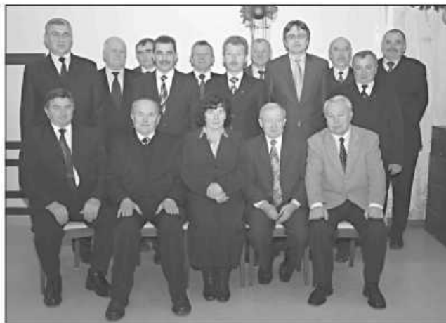
Radni podczas ostatniej w 2008 r. sesji uchwalili budżet na 2009 r.

Ustawa Prawo zamówień publicznych zezwala na zawarcie umowy w zakresie wydatków bieżących na okres dłuższy niż rok budżetowy. Aby skorzystać z niniejszej możliwości konieczne jest posiadanie przez wójta stosownego upoważnienia. Radni podjęli aktualny wykaz zadań i kwot wydatków bieżą-