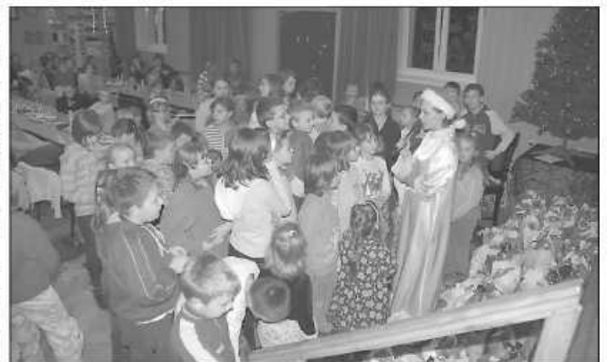
Spotkanie z Mikołajem to nie tylko prezenty