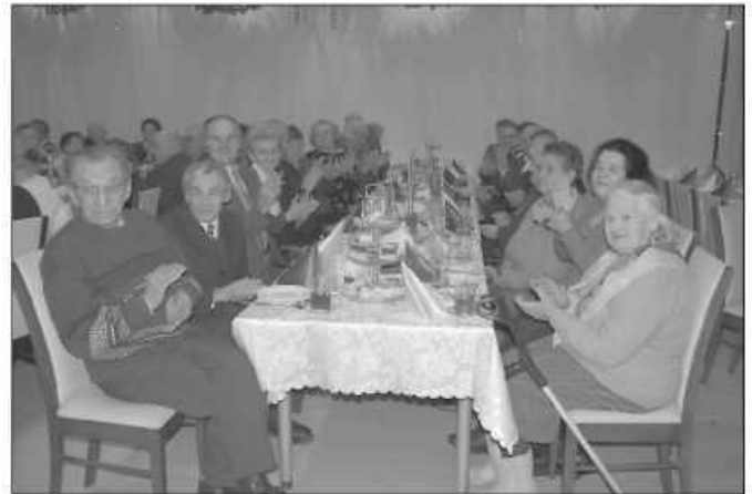
Nawet w rozległym sołectwie mieszkańcy mogą mieć bliżej do siebie