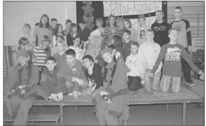
Każda klasa pozowała do zdjęć z Mikołajem

Gimnazjaliści zaglądali w czasie przerw między lekcjami i też nie