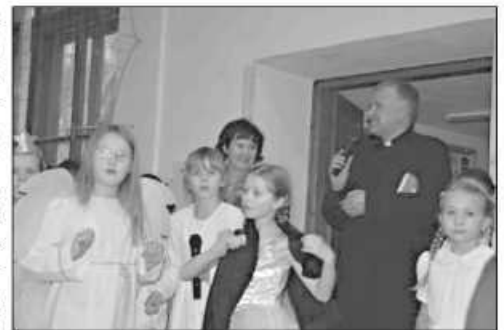
Oplatkiem łamano się też w gronie parafian