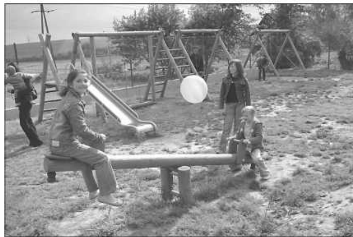
Szczęśliwie w gminie Zielonki mieszkańców przybywa

Dodać należy, że wedle szacunków ok. 2 tys. osób zamieszkuje teren naszej gminy bez zameldowania, czyli rzeczywista liczba mieszkańców zawiera się pomiędzy 1.700 – 1.800 osób. MKF