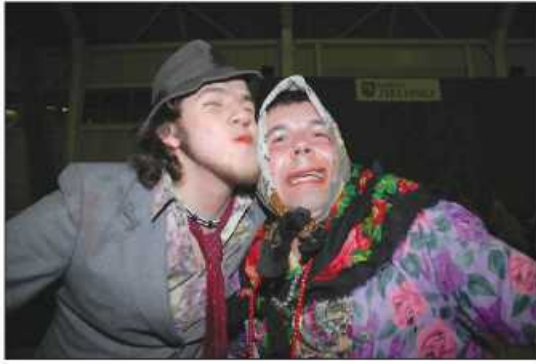
Cygan i cyganka z grupy „Z Konikiem” ze Żmijęcej wzbudzili wielki aplauz