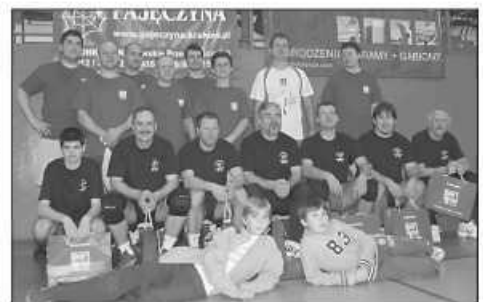
Zapaleni sportowcy z jednej branży

Zwycięska drużyna na co dzień nie trenuje wspólnie. Za to każdy z osobna pasjonuje się siatkówką i jako zawodnicy i jako kibice, co dało znakomite rezultaty. IO