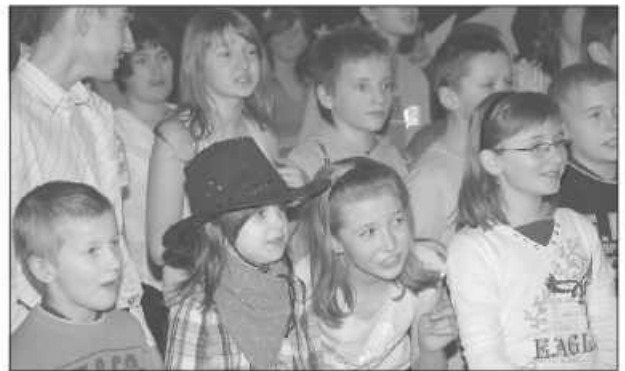
Uczniowie szkoły w Korzkwi są zaprzyjaźnieni z podopiecznymi fundacji „Bądźcie z nami”