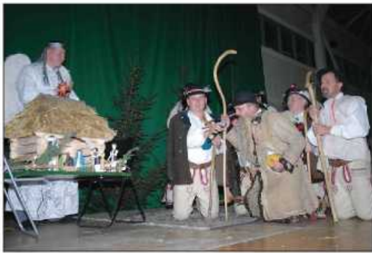
„Pastuszki z Tokarni” - wspaniałe głosy