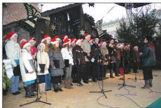
Chór Mezzoforte z Zespołu Szkół w Zielonkach