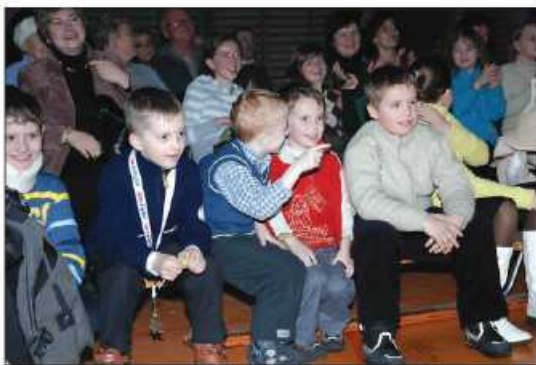
Świetnie bawili się i starsi i młodszy widzowie