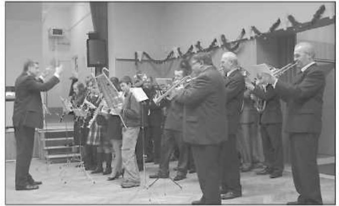
Przed orkiestrą z Zielonek kolejny rok muzycznych wyzwań