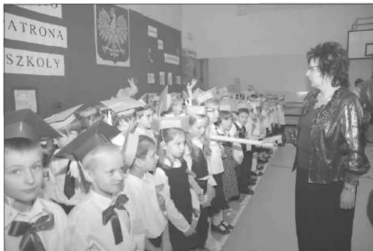
Uroczystie pasowany pierwszak może czuć się pełnoprawnym uczniem szkoły

15 stycznia mija 140 lat od dnia urodzin Stanisława Wyspiańskiego, patrona Szkoły Podstawowej w Bibicach. Corocznie dzień ten jest Świętem Szkoły, szczególnym zaś dla pierwszaków, którzy ślubują przed sztandarem szkoły.