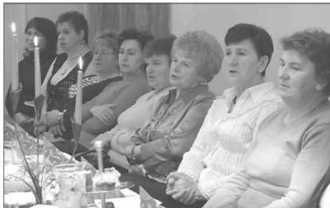
W Woli gościnnie wystąpiły Herody z Maszkowa

Przybyło około 80 osób, w tym seniorzy z terenu sołectwa, członkowie męskiej i żeńskiej róży różańcowej, strażacy, młodzież szkolna. Z zaprzyjaźnionego Maszkowa stawiała się grupa kołędnicza, która ucie-