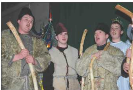
„Pasterze z Koźlicy” - świetnie już znani w Zielonkach

11 stycznia odbył się już dziewiąty Powiatowy Przegląd Grup Kołędniczych w Zielonkach. Najpierw kołędnicy w barwnym korowodzie ruszyli z parkingu przy Urzędzie Gminy w centrum miejscowości w stronę hali sportowej, gdzie dawali występy. A zaprezentowały się najlepsze grupy kołędnicze z powiatu krakowskiego oraz zaproszeni goście z powiatów: limanowskiego, gorlickiego i myślenickiego – łącznie dziesięć zespołów. Nic więc dziwnego, że ich harce trwały aż do godziny dwudziestej, a świetnie bawiła się przy tym publiczność, wypełniająca po brzegi halę sportową w Zielonkach.