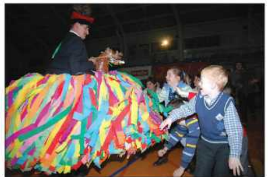
Nie wszyscy się bali kołędników...