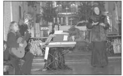
IO Świąteczna sceneria kościoła w Zielonkach podkreśla atmosferę koncertu