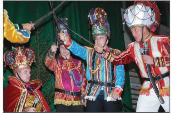
Herody z Zielonek podobały się jak zawsze