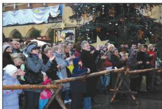
Licznie zebrana publiczność oklaskiwała naszych artystów