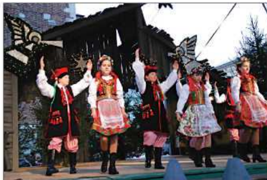
Zespół Ludowy Zieleńczenie