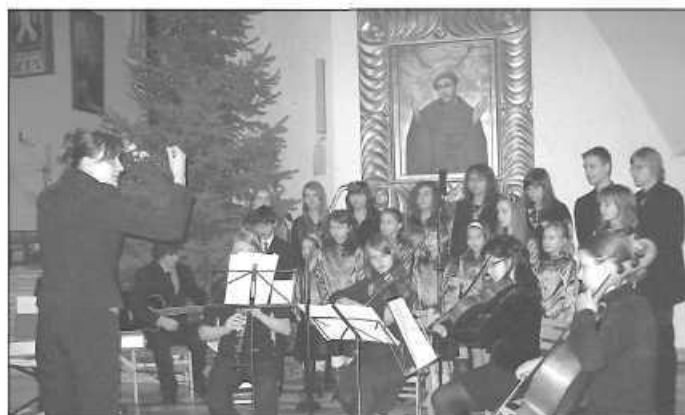
Koncert Fermaty w Bronowicach

Konkurs składał się z dwóch etapów, do 15 grudnia należało przesłać nagranie, co pozwoliło zakwalifikować się do przesłuchań na miejscu. Przegląd konkursowy, w którym startowało kilkadziesiąt grup wokalnych i solistów