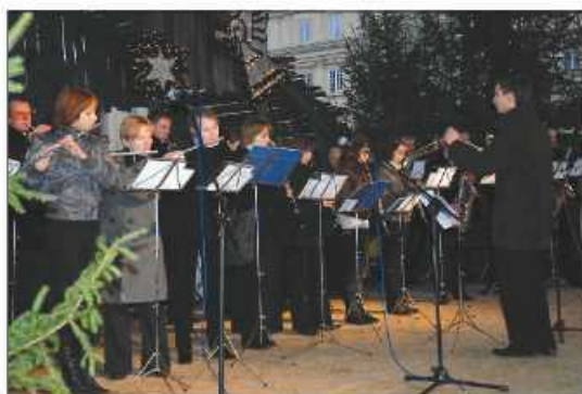
Parafialna Orkiestra Dęta z Korzkwi