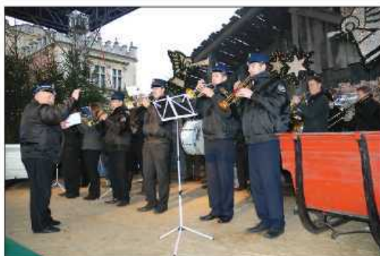
Orkiestra Wola z Woli Zachariaszowskiej