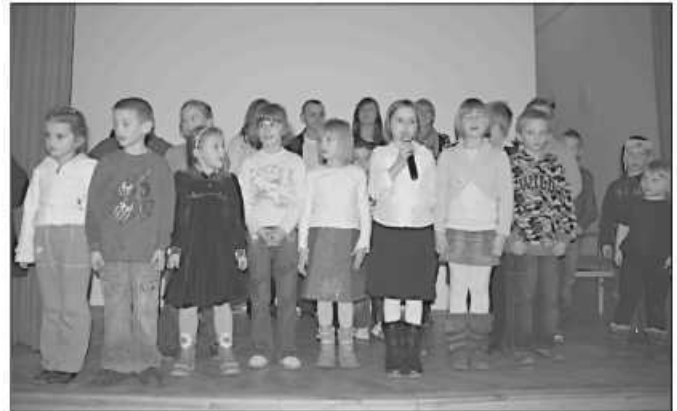
Spotkanie zwieńczyła wspólna kolęda

Spotkanie zaowocowało również rozstrzygnięciem konkursu na logo świetlicy. Propozycje przysłały trzy placówki – z Garlicy