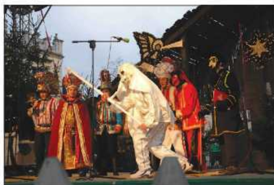
Grupa Herody z Zielonek