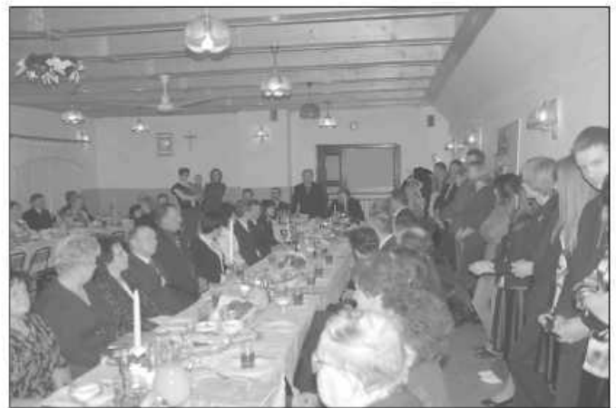
W Brzozówce również zadbano o świąteczną tradycję