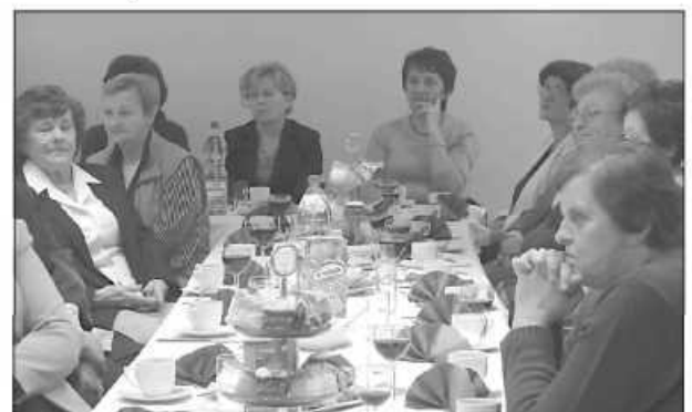
Nauczyciele na emeryturze nie tracą kontaktu ze szkołą

Nauczycielom towarzyszyli dyrektorzy poszczególnych placówek. Rozmowy toczono przy smacznym poczęstunku z nadzieją, że przy kolejnym spotkaniu bardziej dopisze frekwencja. Tym razem zabrakło połowy zaproszonych. IO