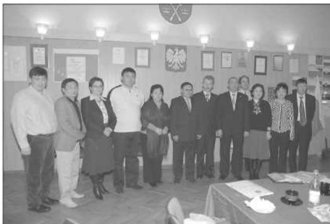
Goście z Mongolii byli zainteresowani jak działa samorządność lokalna w Polsce

– Od dwóch dni zapoznajemy się z doświadczeniami jednostek samorządu terytorialnego w Polsce. Mało się na tym znamy, ale ocena nasza jest taka, że wiele osiągnęliście dla swojego społeczeństwa, rozwijając je na właści-