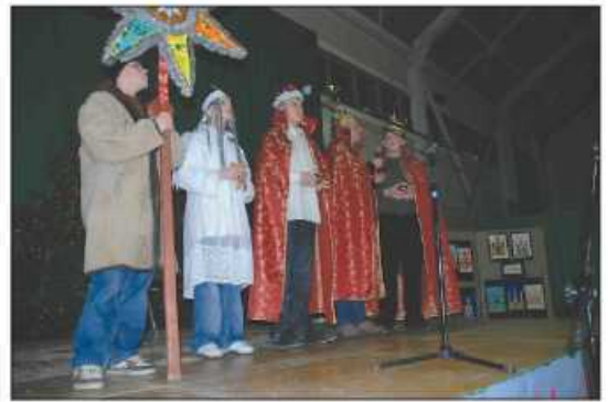
Trzej Królowie z Trojanowic wystąpili w nowych strojach