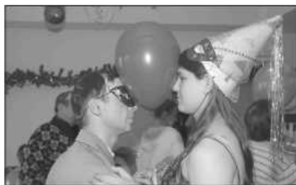
Jak karnawał to i przebranie

Skoro w najlepsze trwa karnawał, dobrej zabawy nie mogło zabraknąć również w Środowiskowym Domu Samopomocy w Woli Zachariaszowskiej podczas balu integracyjnego. 5 lutego przyjechały do Woli grupy z zaprzyjaźnionych ośrodków z Proszowic, Olkusza i Wolbromia.