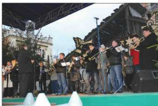
Parafialno-Gminna Orkiestra Dęta z Zielonek