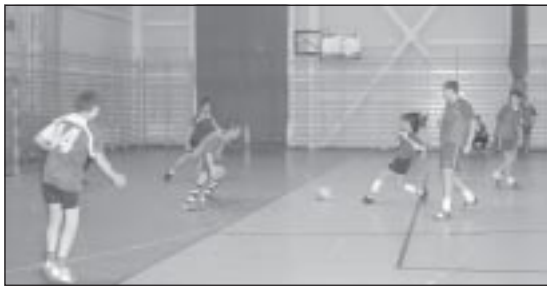
Turniej o Puchar Przewodniczącego Rady Gminy

Centrum Kultury, Promocji i Rekreacji wraz z Zespołem Szkół w Zielonkach po raz kolejny zorganizowało „Ferie w gminie Zielonki”, podczas których zaoferowano dzieciom i młodzieży możliwość ciekawego spędzenia wolnego czasu. Były różnorodne zajęcia w hali sportowej i wycieczki oraz turnieje piłki nożnej o puchar przewodniczącego Rady Gminy.