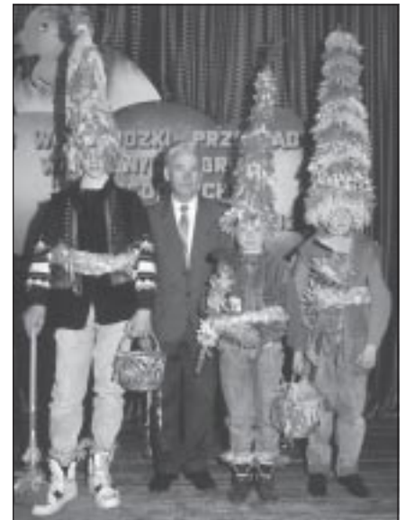
Propagował też tradycję pucheroków