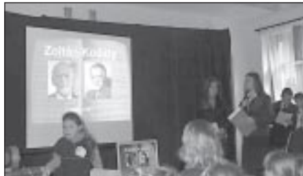
Dzień muzyki węgierskiej

W tygodniu poprzedzającym ferie zimowe szkoła w Korzkwi obrosła papryką. To narodowe warzywo Węgier, kraju naszego szkolnego partnera. W ramach projektu Comeniusa rozpoczęliśmy w ten sposób realizację kolejnego zaplanowanego działania, polegającego na prezentacji krajów i kultur wszystkich szkół uczestniczących w partnerstwie.