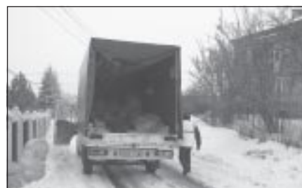
Przed prawie każdą bramą stoją worki z posegregowanymi odpadami

Obecnie jedynie na terenach Szkół w Korzkwi, Zielonkach, Woli Zachariaszowskiej i Bibicach oraz przy mieszkalnych budynkach komunalnych w Zielonkach (ul. Galicyjska) znajdują się jeszcze ogólnodostępne pojemniki do segregacji odpadów (tzw. dzwony), natomiast na terenach sołectw całkowicie zrezygnowano ze zbiórki odpadów w pojemnikach, zastępując je w całości odbiorem posegregowanych odpadów sprzed posesji mieszkańców.