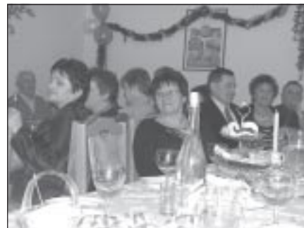
Dla babć i dziadków wystąpiły wnuczeta

Obok najmłodszych wystąpili i starsi - kabaret „Trzydziestka”, który rozbawił wszystkich do łez. Było i na wesoło i na poważnie. Jedna z występujących zadeklamowała na koniec: