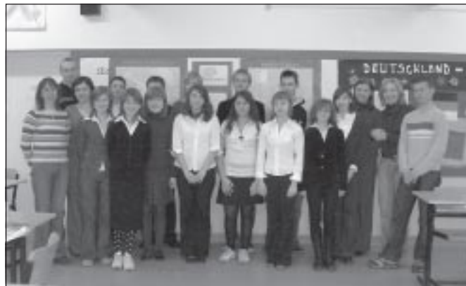
Finaliści Gminnego Konkursu Wiedzy o Krajach Anglojęzycznych

II Gminny Konkurs Wiedzy o Krajach Anglojęzycznych odbył się w formie prezentacji multimedialnych. Uczniowie szkół podstawowych i gimnazjów, którzy spotkali się 19 lutego na finale w szkole w Zielonkach, nie tylko musieli płynnie mówić po angielsku, ale jeszcze przygotować ciekawą prezentację multimedialną o jednym z parków narodowych w Stanach Zjednoczonych.