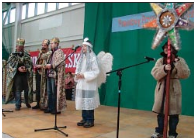
Trzej królowie z Trojanowic