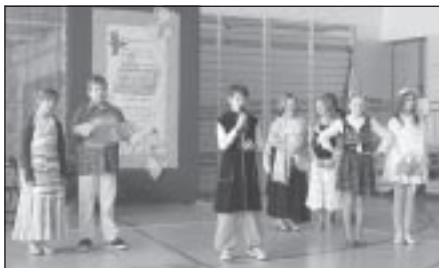
Przedstawienie poświęcone S. Wyspiańskiemu

15 stycznia to rocznica urodzin Stanisława Wyspiańskiego. Tego dnia, tradycyjnie odbywa się święto patrona w Zespole Szkół w Bibicach.