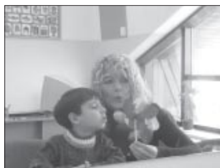
Ćwiczyć trzeba też z dzieckiem w domu

W okresie zerowym rozwijają się obwodowe i centralne narządy mowne. Od prawidłowej budowy narządów: centralnych ośrodków w układzie nerwowym, ucha jako narządu słuchu, układu oddechowego oraz jamy ustnej zależy późniejsze ich funkcjonowanie w procesie kształtowania się mowy dziecka.