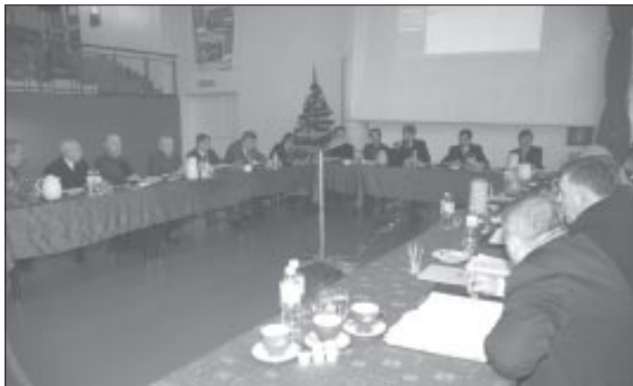
Radni uchwalili budżet na 2008 r.

Nowy statut bardzo szczegółowo określa, m.in. osoby uprawnione do głosowania oraz mające czynne i bierne prawo wyborcze. Prawo to ma każdy obywatel polski oraz Unii Europejskiej nie będący obywatelem polskim, który najpóźniej w dniu wyborów skończy 18 lat i stale zamieszkuje na terenie gminy (za wyjątkiem osób pozbawionych praw publicznych lub praw wyborczych czy osób ubezwłasnowolnionych). Jako osobę stale zamieszukującą określono: osobę zameldowaną na pobyt stały, pobyt czasowy oraz osobę zamieszukującą sołectwo z zamiarem stałego pobytu, która złoży w dniu wyborów stosowne oświad-