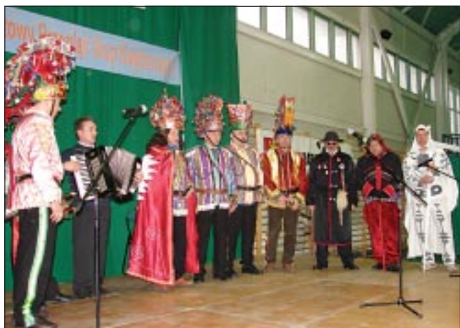
Herody z Modlnicy