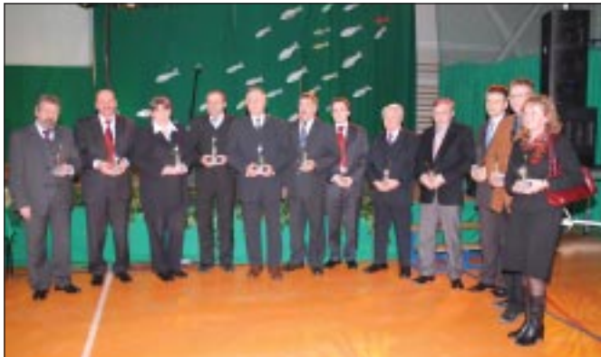
Laureaci nagrody samorządowej gm. Zielonki ze statuetkami „Śledzika”

„Śledzik u wójtów” to odbywająca się co roku w ostatni dzień karnawału impreza promocyjna gminy Zielonki, mająca na celu podsumowanie ubiegłego roku, prezentację przedsięwzięć i osiągnięć gminy Zielonki. W tym roku „Śledzik” odbył się 5 lutego, tradycyjnie już w hali sportowej w Zielonkach. I tak jak co roku w pożegnaniu karnawału w Zielonkach uczestniczyło ok. 500 zaproszonych gości – przedstawiciele samorządowych władz województwa, powiatu i gmin sąsiednich, a także administracji rządowej i parlamentarzystów, jak również przedstawiciele firm działających na terenie gminy i lokalnych organizacji społecznych.