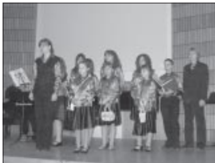
Zespół „Fermata” koncertował dla dzieci

29 lutego 2008 r. w Akademii Muzycznej w Krakowie odbył się koncert edukacyjny dla dzieci pt. „Duży i mały”. Wzjął w nim udział zespół „Fermata”.