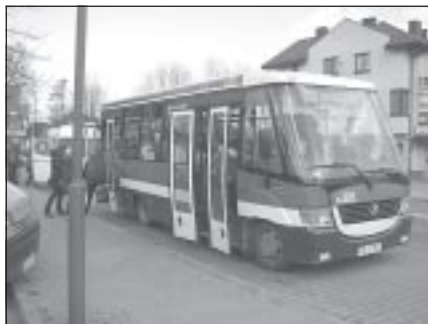
Transport aglomeracyjny ruszył od 1.01.2008 r.

Tak jak już pisaliśmy w poprzednim numerze, gmina Zielonki wraz z gminami Skawina, Skała, Świątniki, Wieliczka, Czernichów, Iwanowice, Kocmyrzów-Luborzyca, Liszki, Michałowice, Mogilany, Wielka Wieś, Zabierzów, podpisały porozumienie na mocy którego od 1 stycznia 2008 gmina Kraków przejęła organizowanie zintegrowanego transportu zbiorowego dla całego terenu aglomeracji. Zawarcie porozumienia międzygminnego było niezbędne w celu uregulowania prawnego i finansowego funkcjonowania tzw. linii podmiejskich. Warto tutaj podkreślić, że MPK, które dotychczas jako jedyna firma wykonuje usługi komunikacyjne dla miasta i gmin sąsiednich w ramach tego porozumienia, jest spółką akcyjną należącą wyłącznie do miasta Krakowa, czyli jest przedsiębiorstwem użyteczności publicznej realizującym zadania własne gminy Kraków, ale działającym na zasadach komercyjnych.