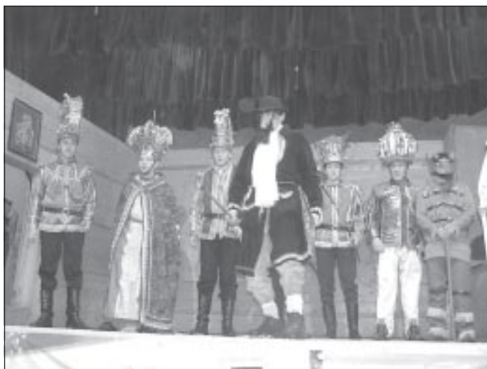
To już trzecia „Srebrna spinka” Herodów z Zielonek

Karnawał Góralski to najważniejsza impreza kołędnicza w naszym kraju. Podczas niej profesjonalne jury bardzo wszechstronnie ocenia umiejętności grup kołędniczych z całej Polski