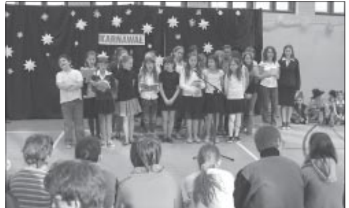
Dla gości zaśpiewał szkolny chór

Już dwunasty raz na zaproszenie dyrekcji Zespołu Szkół w Korzkwi na Bal Karnawałowy przybyły niepełnosprawne dzieci. Zabawa odbyła się 17 stycznia.