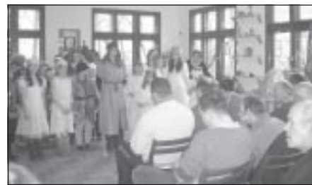
Występ w DPS w Owczarach