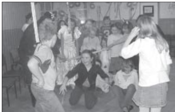
Dzieci bawiły się świetnie

W pięknie udekorowanej i kolorowej sali, która tego popołudnia nie przypominała świetlicy, bawiło się ok. 50 osób a wśród nich: księżę z bajki, królowy, księżniczki, Czerwony Kapturek, biedroneczka, a nawet groźny pirat z jednym okiem, pielęgniarka ze strzykawką, Cyganka i wiele innych bajkowych postaci. Odbywały się konkursy tańca, układów tanecznych, nie obyło się też bez „kaczuszek”. Co najbardziej zaskoczyło organizatorów balu to to, że do zabawy przyłączyli się również rodzice, niektórzy również w strojach karnawałowych. Wszyscy, zarówno dzieci, jak i dorośli bawili się cudownie, bardzo smakował poczęstunek przygotowany przez KGW w Garlicy Murowanej. Magdalena Maniecka