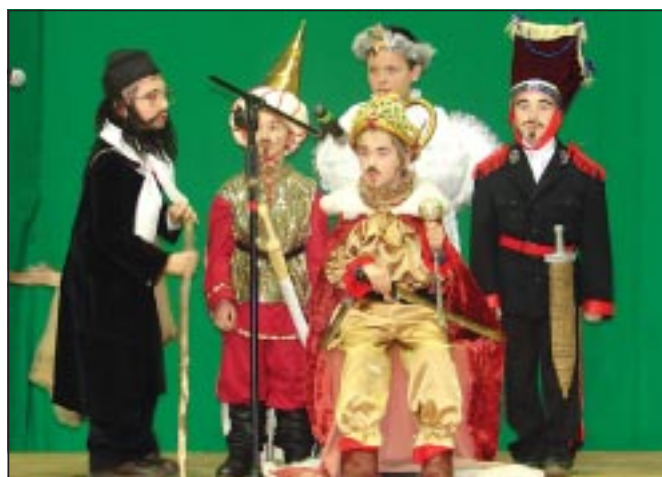
Kołędnicy ze Szkoły Podstawowej w Janowicach