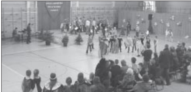
Na scenie licznie prezentowały się dzieci. Widzowie też dopisali

W gminie Zielonki Wielka Orkiestra Świątecznej Pomocy zagrała tym razem po raz ósmy. Dochód z 20 puszek oraz aukcji, kawiarenki i fantów wyniósł 11.136 zł. Pieniądze zbierano, m.in. w Zielonkach, Korzkwi, Pękowicach, Giebułtowiu, Toniach, Witkowicach i Smardzowicach.